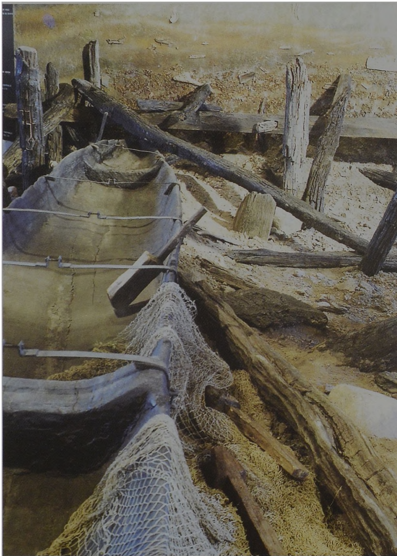
Ryc. 3. Odtworzone rumowisko jednego z lednickich mostów oraz jego przyczółka.

W sąsiedztwie takiego otoczenia odkryto łódź