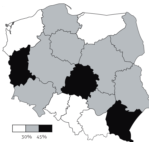
Ryc. 2. Małe miasta z ulicą Jana Pawła II w 2013 roku

Pewnym zaskoczeniem jawi się niski udział ulic Jana Pawła II w regionie, z którego pochodził i na terenie którego w 2008 roku było najwięcej (71) jego pomników ( http://www.msw-pttk.org.pl/odznaki/reg_odznak/pjp2_mapa.html , stan na 03.06.2008, data dostępu 12.10.2012). Małą liczbę miast (w tym także małych) z „ulicą papieską” w woj. małopolskim rekompensuje w pewien sposób fakt, że w tym regionie jest najwięcej wsi z tego typu ulicą czy placem w stosunku do liczby miast (23 miasta i 43 wsie lub osady, a np. w podlaskim 20 miast i 5 wsi). Interesujące, że niewielka liczba „ulic papieskich” w woj. zachodniopomorskim, śląskim i opolskim koresponduje z najniższym udziałem (poniżej 5%) szkół podstawowych i gimnazjalnych im. Jana Pawła II w tychże województwach (Przybylska [w druku]). Jak wskazuje kartogram (ryc. 2), nie można wyznaczyć obszaru południowej, północnej czy wschodniej lub zachodniej części kraju, w której znajdowałyby się grupa województw o najwyższym udziale małych miast z ulicami Jana Pawła II; powyżej 45% małych miast z „ulicą papieską” znajduje się bowiem w woj. lubuskim, łódzkim i podkarpackim.