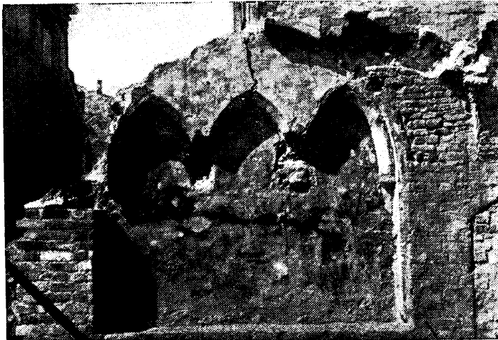
Ryc. 88. Warszawa, Rynek St. Miasta. Ściana szczytowa od nr. 22. Wnęka gotycka, pokryta polichromią.

Nasza wiedza o zachowanych elementach gotyckich na Starym Mieście dotyczyła przed wojną przede wszystkim murów obronnych częściowo odsłoniętych, w większości tkwiących w zabudowie Podwala, Mostowej i Brzozowej, następnie Katedry, wieży augustiańskiej, 3 kamienic w Rynku, kamienicy na Nowomiejskiej i Krzywym Kole oraz Zamku.