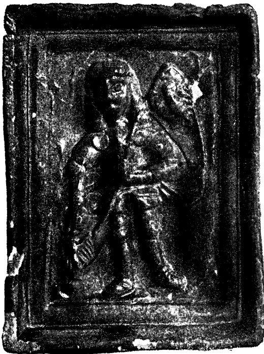
Ryc. 85. Opole. Kafel z wyobrażeniem księcia śląskiego.

budynków. Mury obronne o gotyckim wątku i formie cegły (ryc. 86), wypełnione były wewnątrz dwu okładzin wiązanych gruzem z cegieł, połączonych zaprawą murarską. Słaby ten mur, wzmocniony był szkarpami. Mury wchodzące w skład budynków, wzniesiono w czasach późniejszych. Z tego samego okresu pochodzą szczątki sklepień. Z zamkiem związana jest wielka ilość zabytków ruchomych, jak kafle, cegły profilowane, skorupy naczyń glinianych, kości zwierzęce itd.