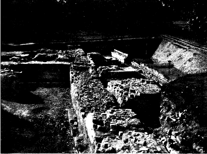
Ryc. 87. Opole. Ogólny widok wykopalisk. Z prawej strony gotycki mur obronny, niżej mury budowli pogotyckich i ściany chat.