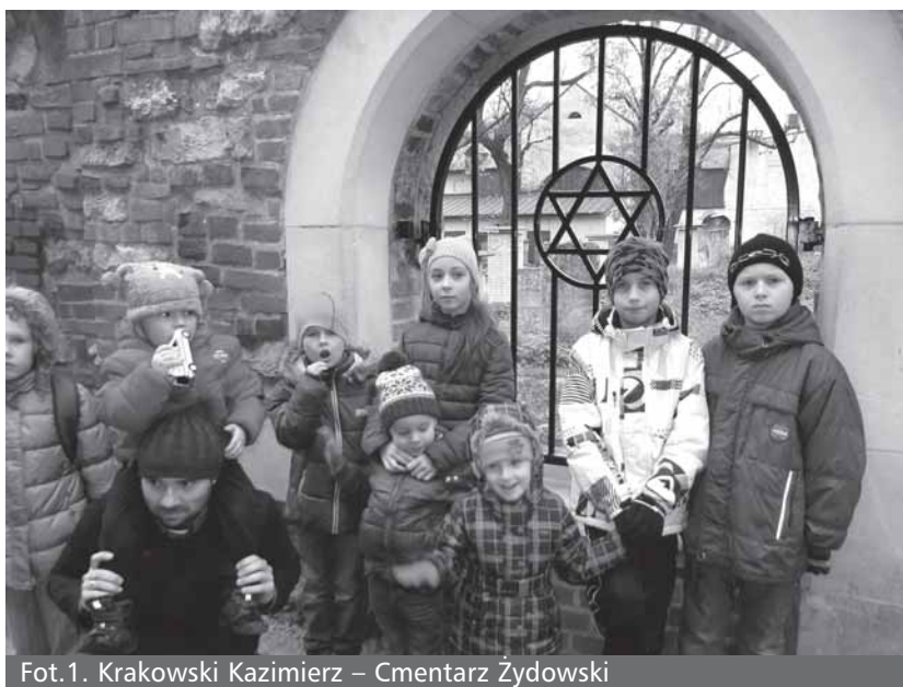
Fot.1. Krakowski Kazimierz – Cmentarz Żydowski