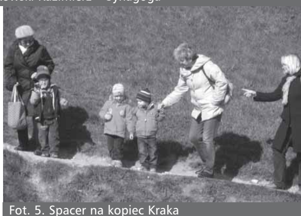
Fot. 5. Spacer na kopiec Kraka