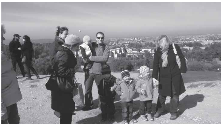
Fot. 3. Spacer na kopiec Kraka