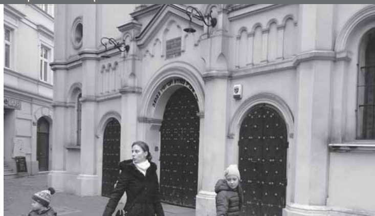
Fot. 4. Krakowski Kazimierz – Synagoga