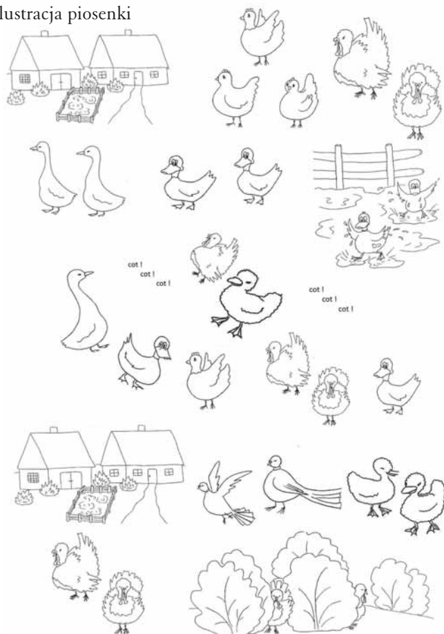
Załącznik 1. Ilustracja piosenki

Wspólnie wymyślamy gesty do poszczególnych fraz piosenki. Każde dziecko ma możliwość wymyślić i zaproponować nawet kilka gestów.