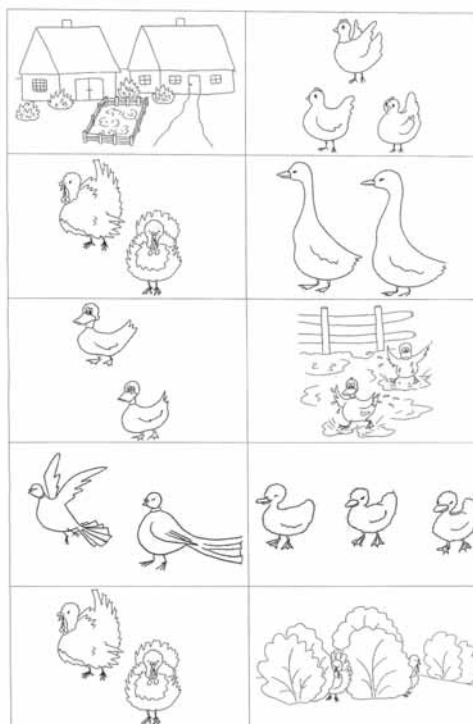
Załącznik 3. Karty memo

Nauczyciel rozdaje dzieciom karty memo do nowej piosenki (zał. 3). Następnie mówi treść piosenki, a zadaniem dzieci jest ułożyć rysunki w odpowiedniej kolejności. Gdy piosenka jest już ułożona, nagle zrywa się wielki wiatr i znów wszystkie rysunki są wymieszane! Dzieci ponownie wybierają rysunki, ale inne, niż poprzednio, i znów słuchając nauczyciela, który mówi słowa piosenki, układają z rysunków jej treść.