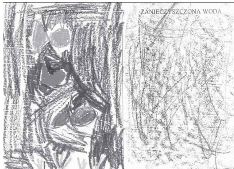
Rys. 1. Emilka, lat 6