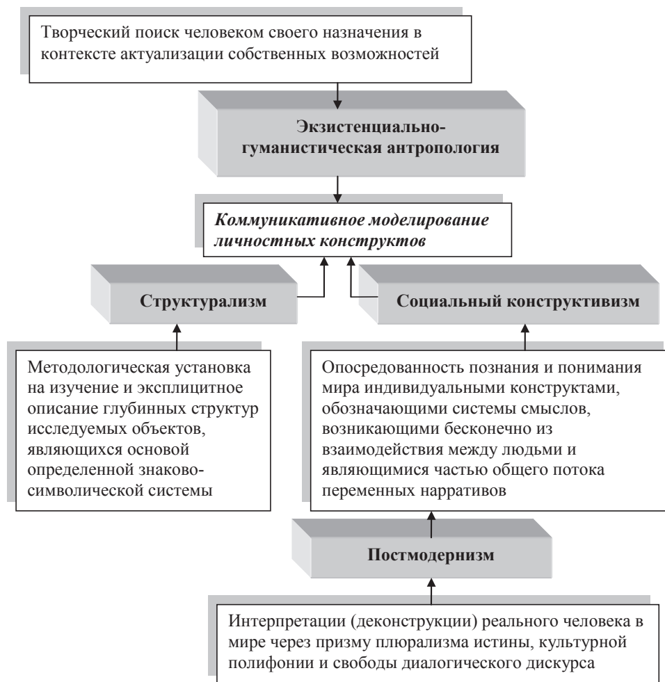
Рис. 1. Методологический синтез философских концептов коммуникативного моделирования личностных конструктов

Принимая во внимание методологическую комплементарность (от лат. complementum – дополнение) выделенных тенденций теоретического обоснования принципов становления личности в изменяющихся условиях современного социокультурного пространства, считаем допустимым в качестве перспективного сценария изучения проблемы коммуникативного моделирования личностных конструктов обозначить интегративный синтез теоретических концептов (рис. 1).