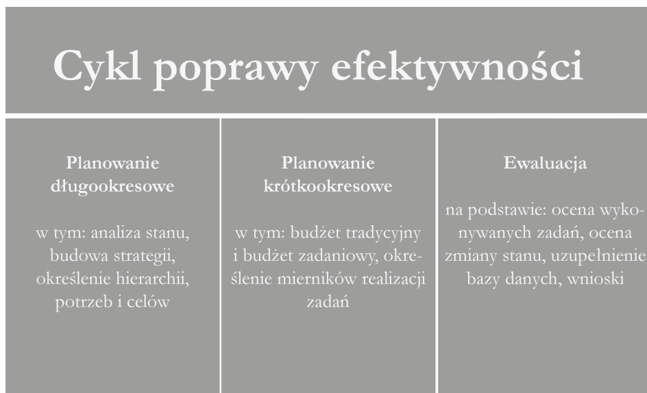
Rys. 1. Cykl poprawy efektywności

Tak pojmowane zarządzanie strategiczne w sektorze publicznym wskazuje, że poprawa efektywności gospodarowania związana jest z uruchomieniem określonego procesu, co ilustruje poniższy rysunek.