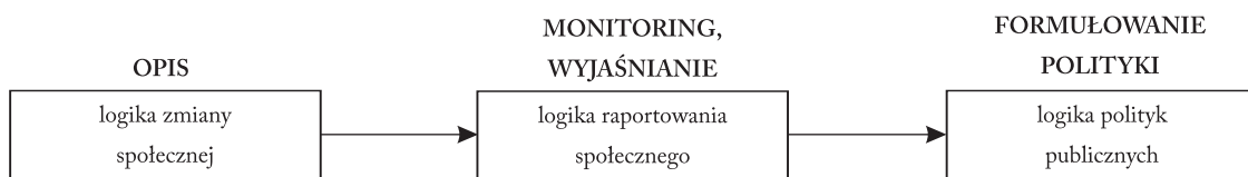
Ryc. 2. Logiki wykorzystania wskaźników społecznych