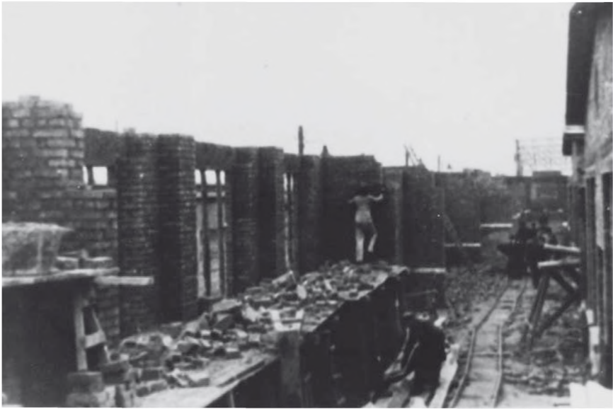
DAW – więźniowie przy pracy

Nie wszyscy więźniowie mieli jednak możliwość pracy w budynku.