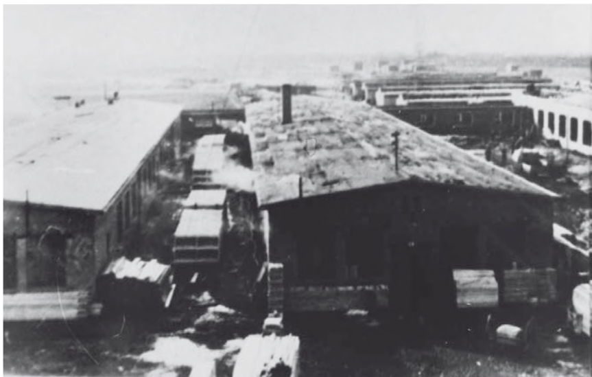
Hale DAW