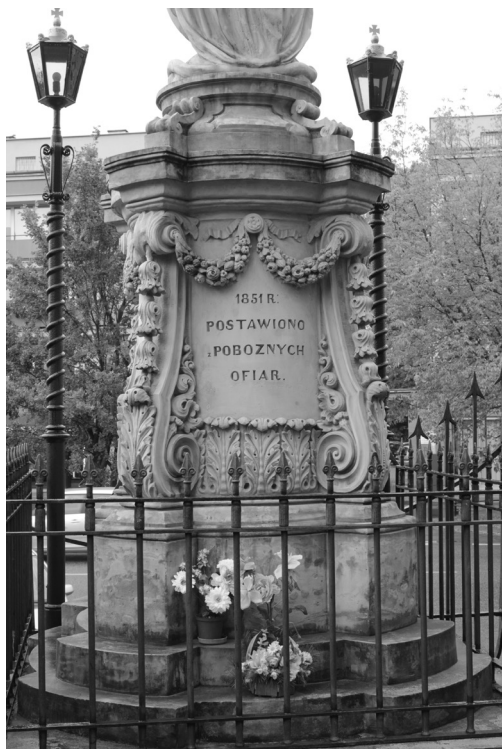
il. 2. Cokół pomnika NMP Niepokalanie Poczętej przed kościołem reformatów w Warszawie, 1851.

typ pomnika grobowego w formie krzyża ustawionego na ozdobnym postumencie. Cokół ten, utrzymany w stylistyce późnobarokowej, ma kształt cylindra zwężającego się nieznacznie ku górze, który ustawiono na szerszej trzystopniowej podstawie i zwieńczono drobno profilowanym gzymsem. Jego trzon ozdabiają cztery narożne woluty o końcach zwiniętych spiralnie do wewnątrz na dole i na zewnątrz u góry. Podparcie dla wolut stanowią zagierowane partie gzymesu i podstawy, które formują na ich osi prostokątne występy. Grzbiety konsol dekorowane są kampanulami tworzącymi zwisy do dwóch trzecich wysokości. Wybrzuszenia znajdujących się na dole wolut zostały ozdobione liśćmi akantu, występującymi również u podstawy cokołu. Górny pas dekoracji tworzą podwójne girlandy kwiatowe, rozpięte pomiędzy wolutami i podwieszane wstążką do ozdobnego kołka, który umieszczono