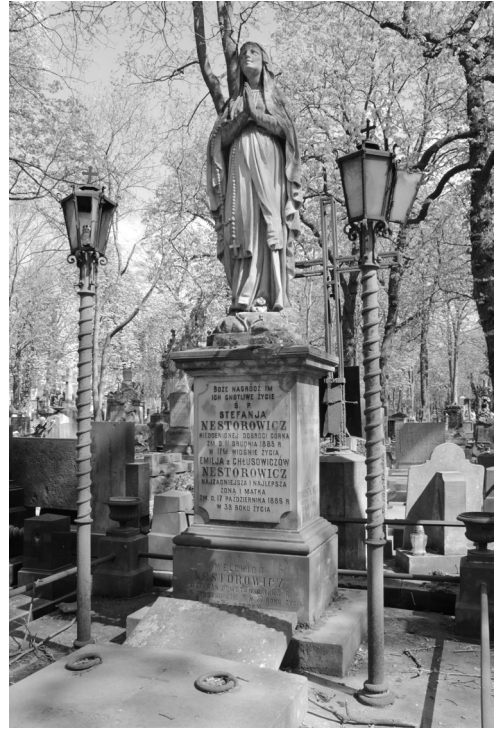
il. 1. Nagrobek Nestorowiczów na Powązkach w Warszawie, ok. 1887.

Poza Warszawą podobne rozwiązanie zostało wykorzystane w tym czasie w Częstochowie przy oświetleniu obrazu Matki Boskiej (1854/1855), znajdującego się na zewnętrznej elewacji, w szczycie kaplicy, w której mieści się cudowny wizerunek Bogarodzicy. Zamówienie