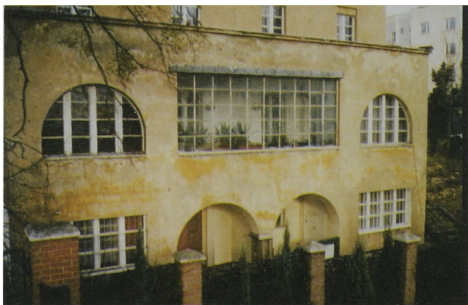
Fot. Dom Kazimierza Ulatowskiego – elewacja południowa