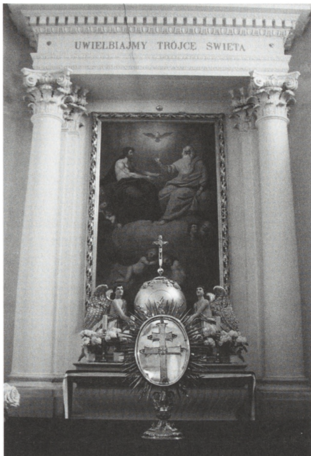
1. Fot. Franciszek Smuglewicz, Trójca Święta , kościół na Świętym Krzyżu

1 octobris. (...). Przy obowiązkach profesorskich miał szczególną pracę w zaprowadzeniu z początków Szkoły Malarskiej w Uniwersytecie Wileńskim oraz ofiarował bezpłatnie znaczną pracę swoją na ozdobienie Sali nowo urządzonej do biblioteki [szczęśliwie zachowane, jako sala Smuglewicza, a odnowionej w okresie międzywojennym przez prof. Hoppena] 34 .