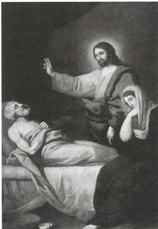
5. Fot. Franciszek Smuglewicz, Śmierć św. Józefa z kościoła na Świętym Krzyżu