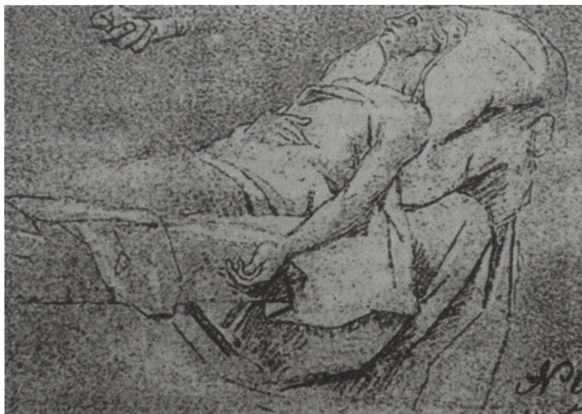
6. Fot. Szkic do obrazu Śmierć Marii z kościoła Bazylianów w Warszawie