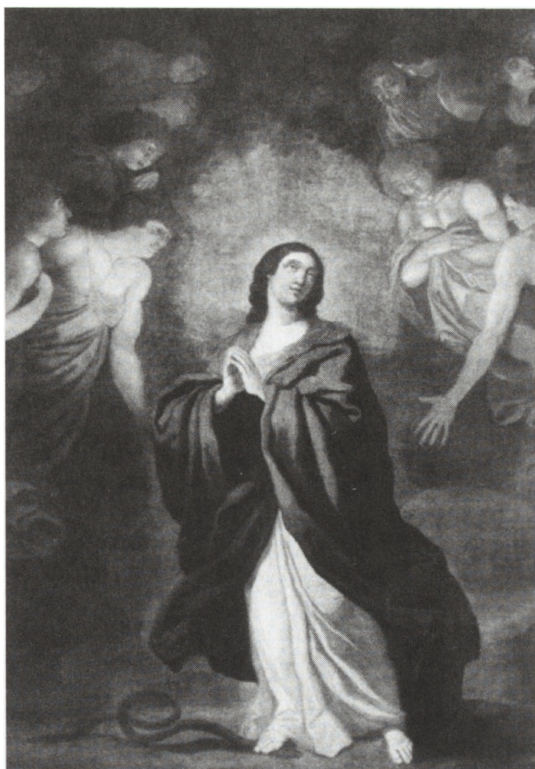
4. Fot. Franciszek Smuglewicz, Niepokalane Poczęcie NMP, kościół na Świętym Krzyżu

Smuglewicz miał wypracowany swój typ twarzy, który powtarza się we wszystkich obrazach na Świętym Krzyżu. Rysem charakterystycznym są długie nosy, małe i pełne usta z uniesionymi ku górze kącikami oraz cienkie brwi nad grubymi powiekami.