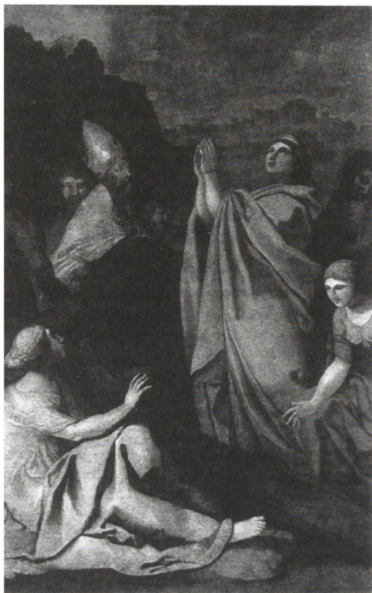
7. Fot. Franciszek Smuglewicz, Znalezienie Drzewa Krzyża Świętego , kościół na Świętym Krzyżu

trzu kościoła. Na stopniach przed ołtarzem stoi św. Benedykt wpatrzony w otwarte niebo, ukazuje mu się Scholastyka siedząca na obłoku. Gest rozpostartych szeroko rąk świętego i podtrzymujący go dwaj zakonnicy, w białych komżach, przywodzą nieodparcie na myśl obraz świętokrzyski 45 . Władis Dréma porównuje obrazy znajdujące się na Świętym Krzyżu z płótnami w kościele Bazylianów 46 . Jak pisze, oba cykle powiązane są wspólnym motywem. Śmierć św. Józefa przypomina obraz Śmierć Marii z kościoła warszawskiego 47 .