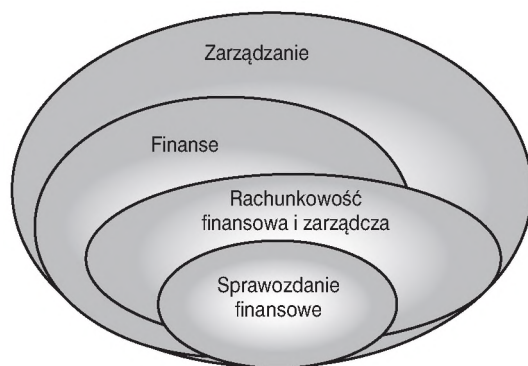
Rys. 2. Powiązania między rachunkowością, finansami a zarządzaniem – spojrzenie kompleksowe.

analizę wartości (Sobańska 2010: 635) czy zwyczajowo dotychczas przypisywane finansom szacunki przyszłych przepływów pieniężnych (Birgham 2001: 452).