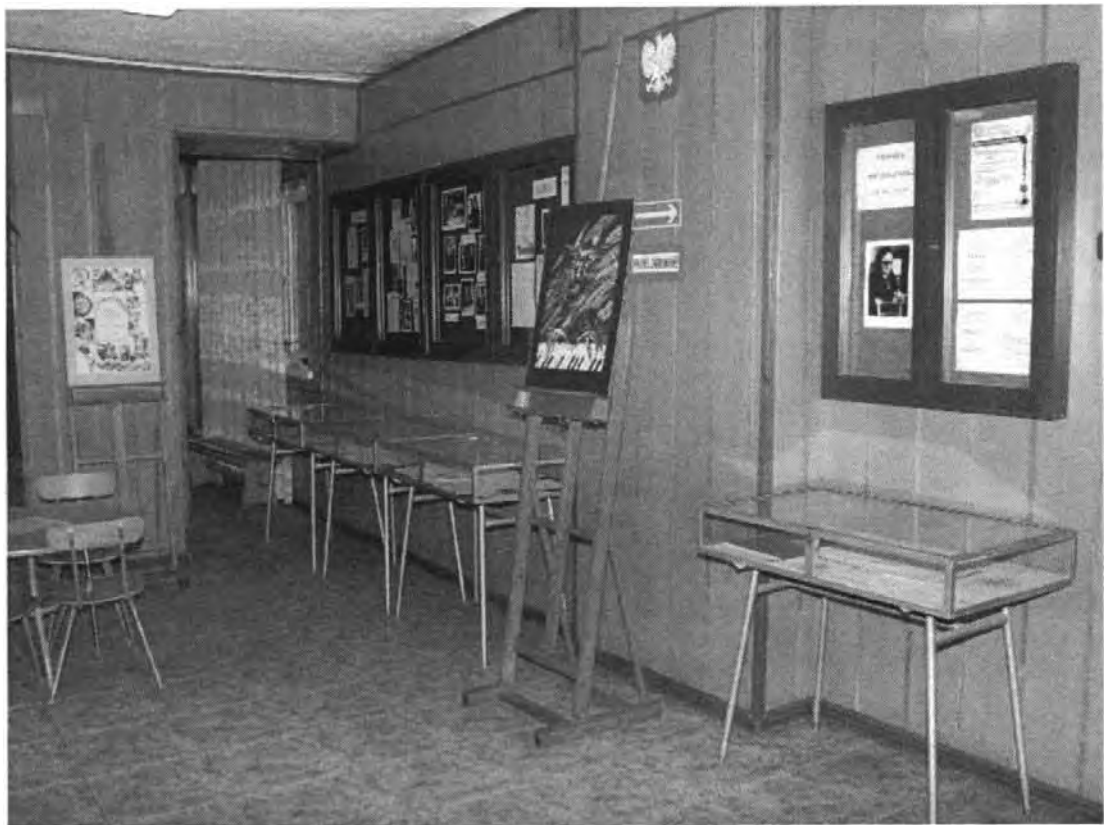
Fot. 18. Wystawa towarzysząca sympozjum „Edward Bogusławski. Twórca i pedagog”, fot. Karol Bogusławski.