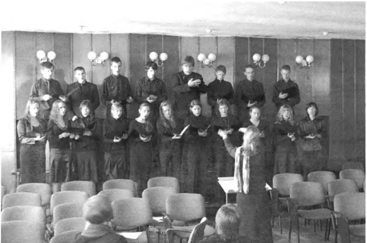
Fot. 12. Chór PSM II stopnia im. M. Karłowicza w Katowicach pod dyrekcją mgr Joanny Marcinowicz, fot. Aleksandra Korcz.