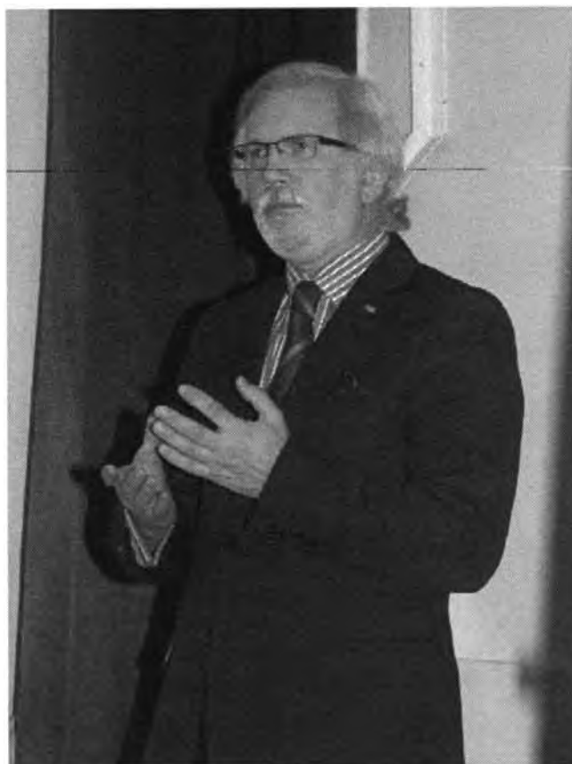
Fot. 5. Prof. Czesław Freund, fot. Karol Bogusławski.