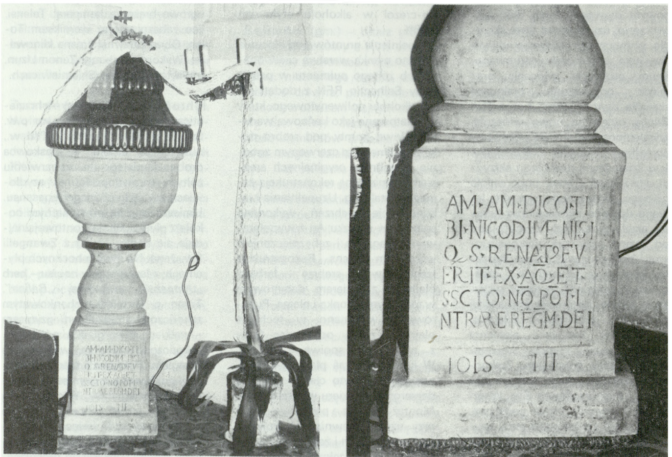
3. Chruślin (gm. Bielawy), chrzcielnica w kościele parafialnym p.w. Św. Michała z 1 połowy XVII w., stan po konserwacji

nionej 10%. Ubytki kamienia uzupełniano sztucznym kamieniem (1 część wapna starego, 1 część Minerosa, kruszywo piaskowcowe) układając warstwowo. Usunięto mechanicznie produkty korozji z metalowej obręczy na trzonie i zabezpieczono je przed korozją Cortaninem. Podobnie postąpiono z bolcem. Po upływie dwóch tygodni od założenia kitów przystąpiono do ich szlifowania kamieniami szlifierskimi pod wodą. Po dosuszeniu kamienie zaimpregnowano środkiem wzmacniająco-hydrofobizującym „Wacker H”. Przepolerowano pokrywą z brązu pastą polerską, a jej powierzchnię pokryto zabez-