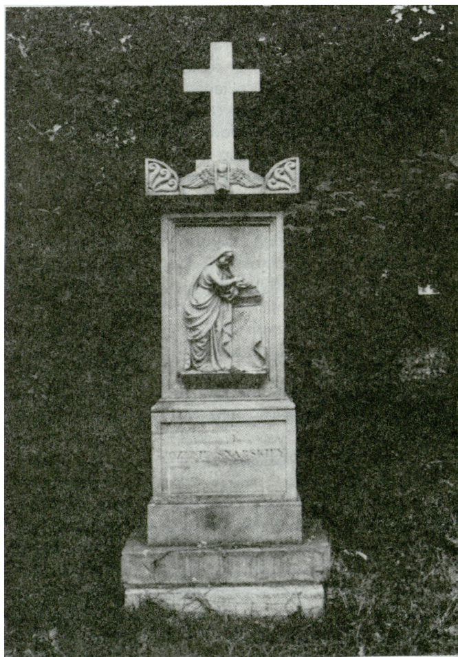
5. Cmentarz w Rawie Mazowieckiej, ul. Tomaszowska. Pomnik nagrobny Józefy Snarskiej z około 1850 r., stan po konserwacji