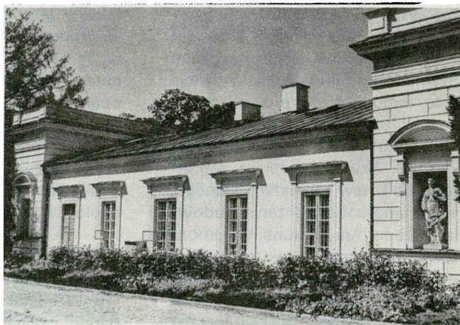
1. Skierniewice, dawna kuchnia pałacowa z XVIII w., przebudowana na oranżerię według projektu Ippolito Monighettiego w końcu XIX w., stan po konserwacji