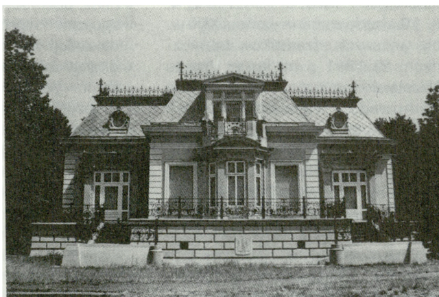
2. Żyrardów, dawna willa Karola Dietricha, zbudowana w osiemdziesiątych latach XIX w., stan po konserwacji