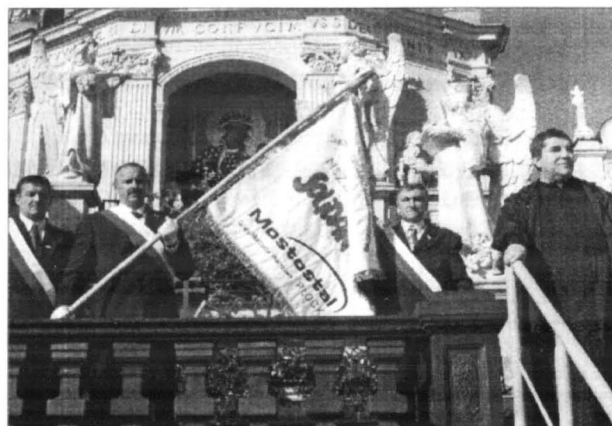
25 września 2005 r. - Płock – Msza święta za wszystkich członków NSZZ „Solidarność” w Bazylice Katedralnej