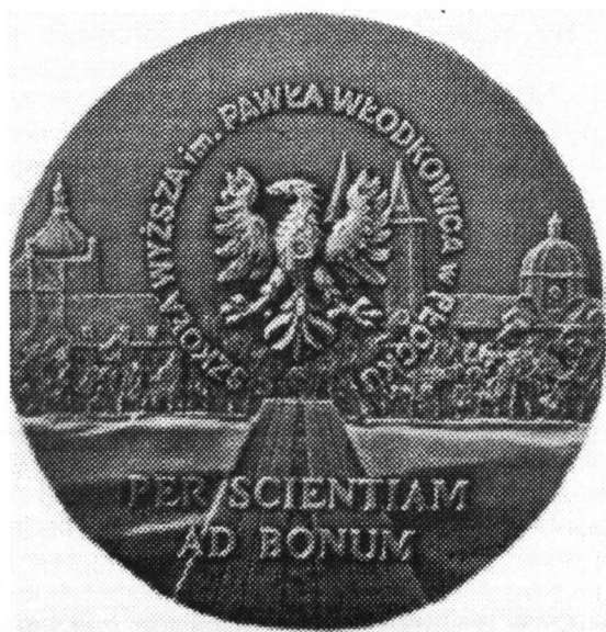
Medal Pawła Włodkowica.