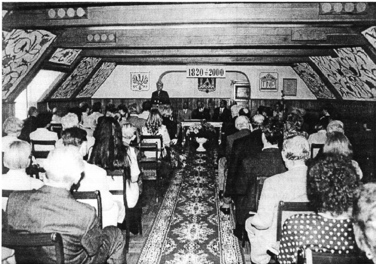
3 czerwca 2000 r, Sala "Nowa". Sesja Jubileuszowa z okazji 180-lecia Towarzystwa Naukowego Płockiego. Widok ogólny sali obrad