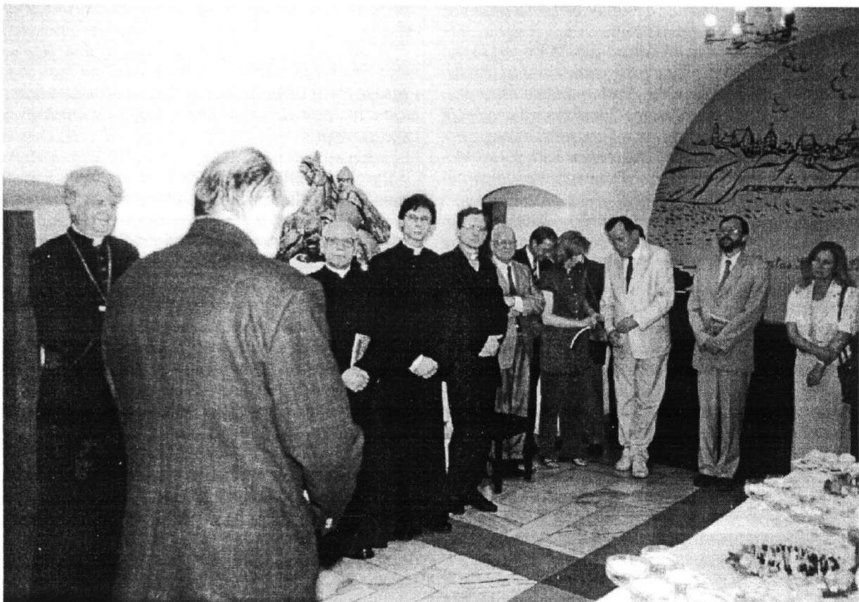
Klub Zbrojownia w siedzibie TNP. Po części oficjalnej Sesji Jubileuszowej poczęstunek dla uczestników