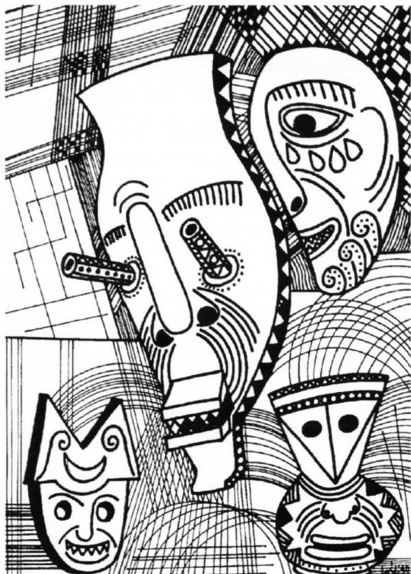
Leon Śliwiński, Kompozycja z czterema maskami na białym tle, linearnie ornamentowanym; czarny tusz; 1994 r.

mną siłą wyrazu, nie zawsze łatwe dla odbiorcy, zyskały wysoką ocenę wśród fachowców.