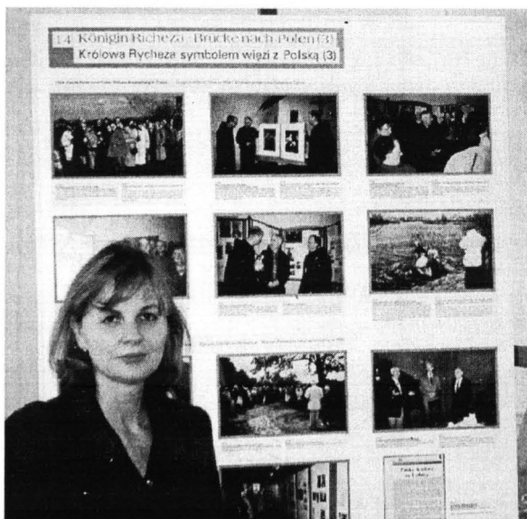
Autorka artykułu - członek TNP - na tle jednej z tablic wystawy

Wystawa czynna była cały wrzesień od poniedziałku do piątku w godzinach - 15 00 -18 00 , w soboty - 14 00 -18 00 i w niedziele - 11 00 -18 00 .