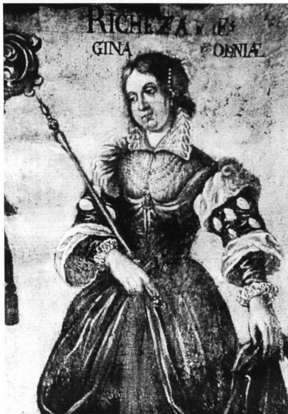
Obraz Rychezy z Opactwa Benedyktynów w Brauweiler

3 września 1998 r. Barokowa, cesarska sala Opactwa Benedyktynów w Brauweiler. W uroczystości otwarcia wystawy "Rycheza - królowa Polski i protektorka opactwa w Brauweiler. Stosunki między Niemcami i Polakami przed 1000 lat". Uczestniczyło około 300 osób