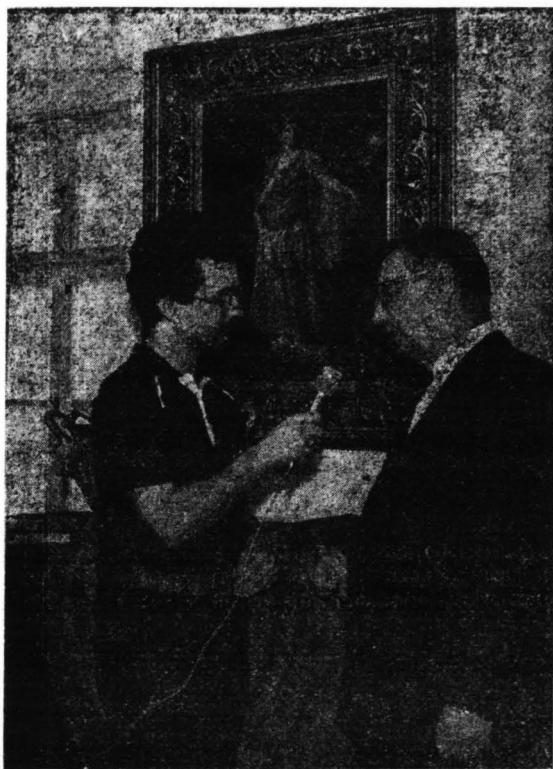
3 maja 1987 r. Muzeum Mazowieckie w Płocku. Na tle portretu Rychezy namalowanego w 1891 r. przez Wojciecha Gersona (1831-1901) pt. „Ryksa — dumna królowa” dr Aleksander Krawczuk, profesor Uniwersytetu Jagiellońskiego — minister Kultury i Sztuki udziela wywiadu Telewizji Polskiej. Portret ten do 1950 r. stanowił własność Towarzystwa Naukowego Płockiego, a po przejęciu naszego Muzeum „w zarząd i użytkowanie państwa” znajduje się w zbiorach państwowego Muzeum Mazowieckiego.