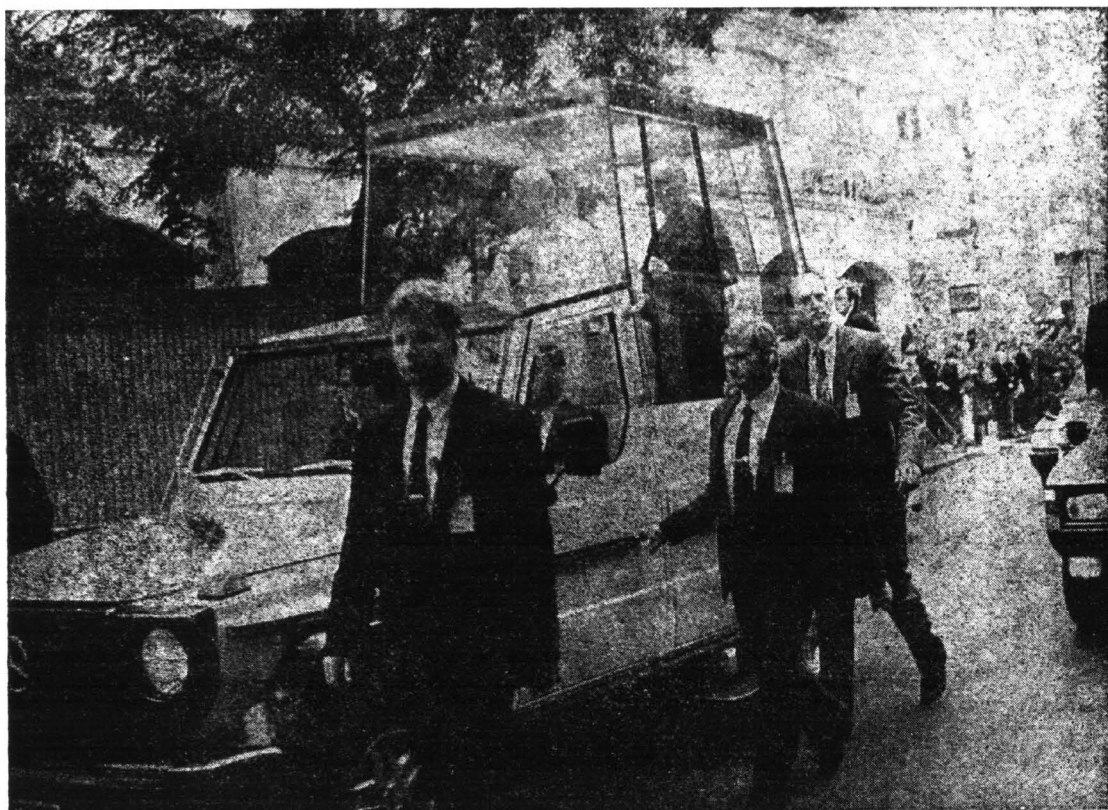
Papież w „papamobile” jedzie ulicą Sienkiewicza na spotkanie z więźniami w Zakładzie Karnym.