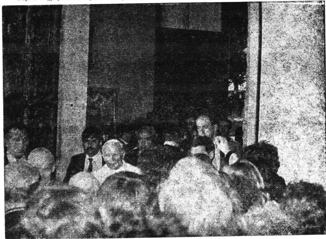
Papież w Bazyllice (pierwotnie romańskiej 1130—1144) przechodzi przez kopię brązowych Drzwi Płockich z połowy XII wieku, wykonanych przez Pracownię Konserwacji Zabytków w Szczecinie i Warszawie. Zawisły one na tym miejscu (d. głównym portalu katedry) dnia 23 listopada 1981 roku, z inicjatywy i po 11 latach starań Zarządu Towarzystwa Naukowego Płockiego — jako dar Rządu Polskiego i Płockiej Petrochemii.