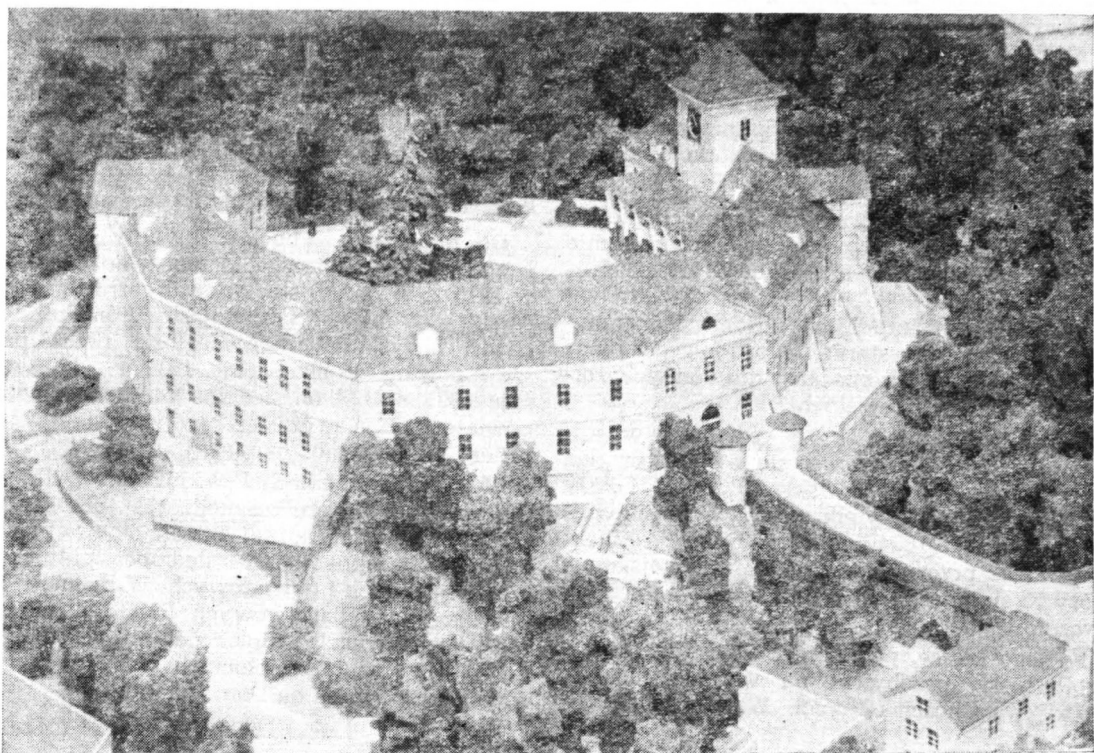
Tak będzie wyglądał Dom Polonii w Pułtusku — przebudowana dawna rezydencja biskupów plockich.

W czasach Królestwa Kongresowego był Pułtusk drugim co do wielkości miastem północnego Mazowsza po Płocku i jednym z sześciu miast obwodowych województwa plockiego. Na początku 1830 r. liczył 4400 mieszkańców i 288 domów, w tym 110 murowanych 36 . Miasto zaczyna się odbudowywać po zniszczeniach wojen napoleońskich i modernizować.