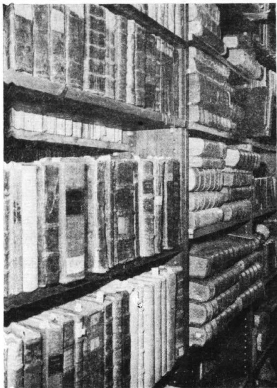
Dział Zbiorów Specjalnych — starodruki, magazyn.