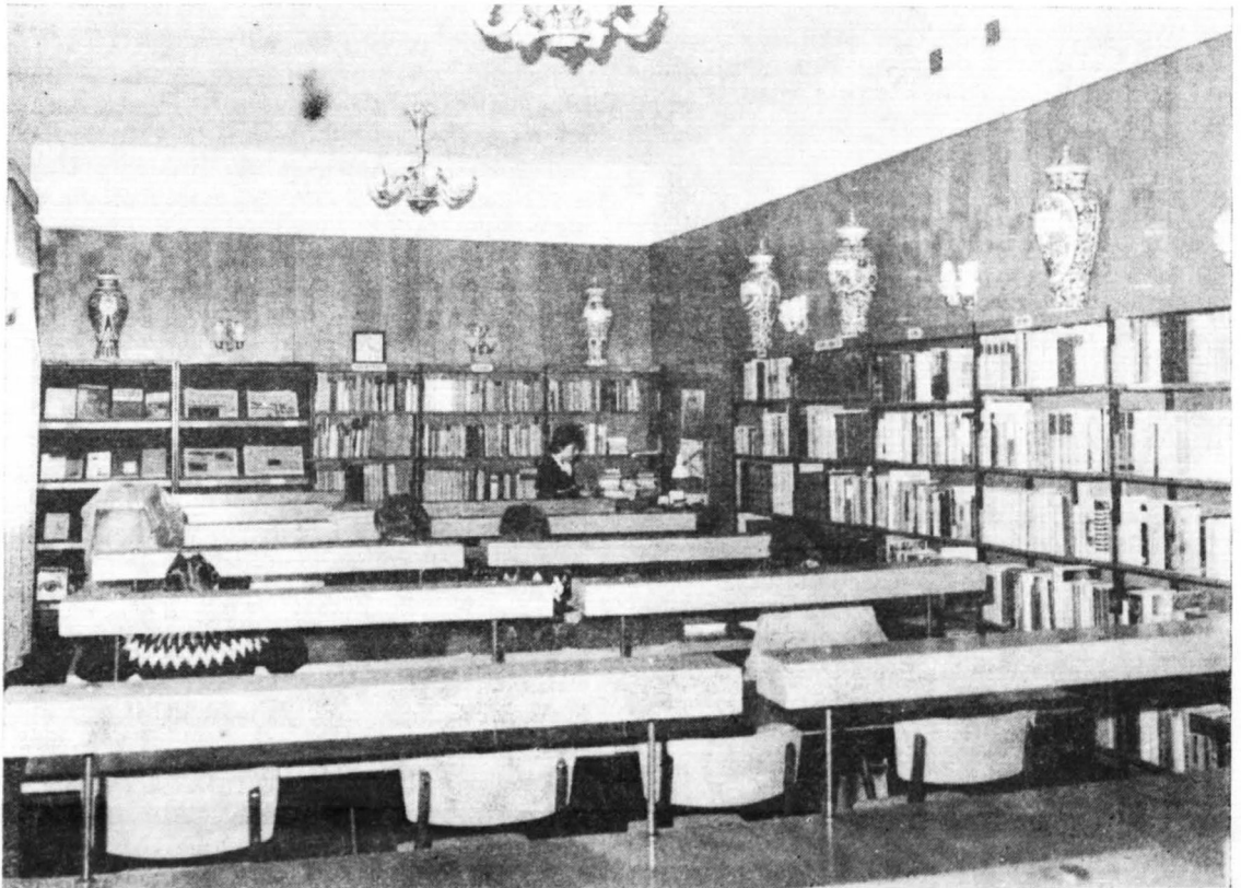
Czytelnia Biblioteki im. Zielińskich TNP.

Cztery pokoje, w których znajdowały się militaria, pamiątki z okresu powstań, rewolucji 1905 r., lat I wojny, zbiory ceramiki, szkła, zamieniono na koszary formacji SS. Wszystkie sprzęty (szafy, gabloty z zawartością) przeniesiono do pomieszczenia pracowni. Broń zabytkową częściowo rozkradziono, częściowo wywieziono na podwórze. Niemcy uszkodzili meble, porozbijali wartościowe szkła, porcelanę saską i polską, zwłaszcza z Korca i Baranówki, oraz fajanse nieborowskie 2 . Z sześciu szaf zawierających szkło i porcelanę ocalała może połowa 3 . W pokojach na pierwszym piętrze panował pozorny porządek, dopiero bliższe zapoznanie się ze zbiorami pozwoliło określić straty. Brak było numizmatów, pamiątek historycznych, grafiki Feliksa Jabłczyńskiego i obrazu olejnego. Najsmutniejszy widok przedstawiał pokój napoleoński. Był on do wysokości 1,5 m wypełniony książkami, przeważnie starodrukami, aktami archiwalnymi oraz luzami. Wszystko osnute było pajęczyną i okryte warstwą kurzu. W pomieszczeniu tym znajdowały