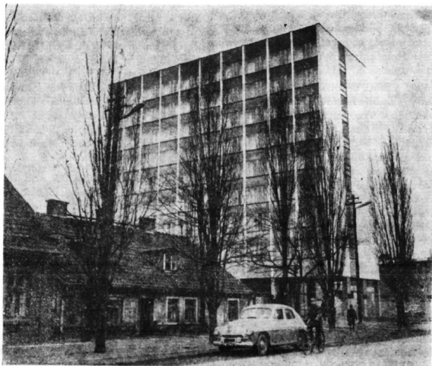
Stary (już nieistniejący) i nowy Płock. Hotel „Petropol” wybudowany ze środków finansowych MZRiP.

Z pozostałej kwoty 1 214 mln zł przeznaczonych na inwestycje nieprzemysłowe, znaczna część związana była z budową kombinatu, bowiem równoległe z uchwałą zatwierdzającą wstępny projekt budowy MZRiP, Komitet Ekonomiczny Rady Ministrów podjął uchwałę w sprawie inwestycji towarzyszących w Płocku i rejonie Płocka w związku z budową Mazowieckich Zakładów Rafineryjnych i Petrochemicznych. 13 Uchwała ta obejmowała 58 tytułów inwestycyjnych, na które w latach 1961—1966 zamierzano wydać 1 020,7 mln zł.