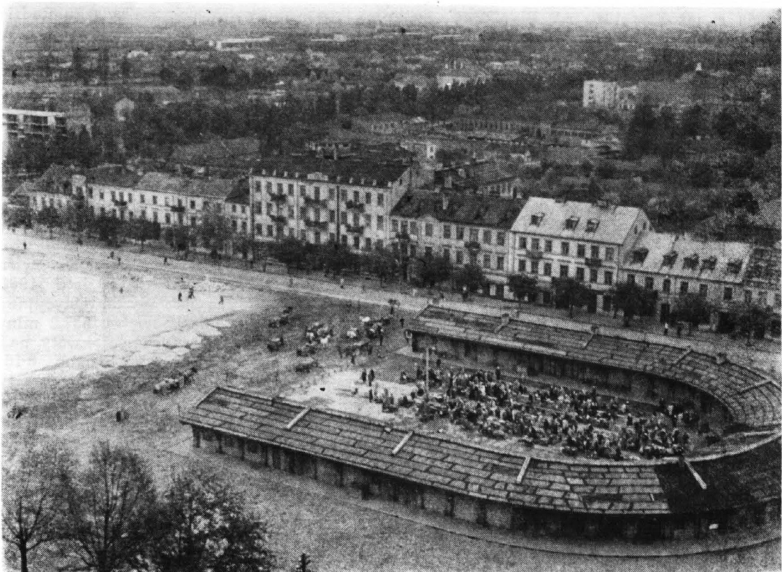
Wygląd zabudowy Nowego Rynku u progu lat sześćdziesiątych.