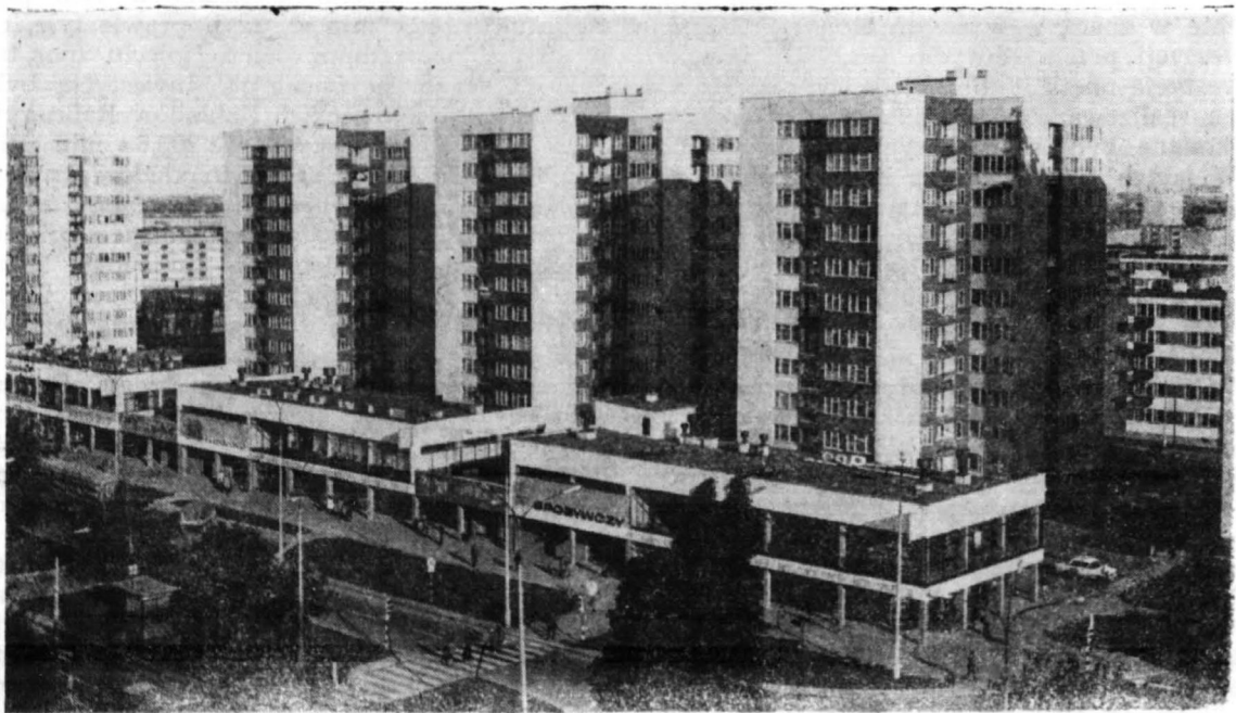
Fragment Osiedla Tysiąclecia wraz z obiektami handlowymi w al. Kobylińskiego.

Lata 1976—1980 miały być kontynuacją okresu „przyspieszonego rozwoju” zarówno w skali kraju jak i miasta Płocka. Na inwestycje przewidziano kwotę 30 mld zł 16 , z czego tylko 61,6% dla MZRiP (18,5 mld zł). Ponad 3,4 mld zł miała kosztować dalsza rozbudowa Fabryki Maszyn Żniwnych do produkcji 8 tys. kombajnów rocznie. Podobną kwotę (3,5 mld zł) przewidziano na budowę rurociągu produktów naftowych do Blachowni, Włocławka i Bydgoszczy. Z ważniejszych inwestycji należy jeszcze wymienić planowaną budowę Zakładu