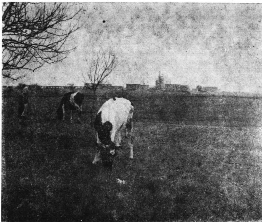
Rok 1963. Stare musi ustąpić nowemu. Początki budowy kombinatu.