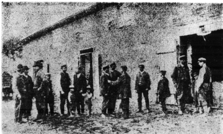
Grupa strajkujących robotników rolnych w majątku Strzelce podczas rewolucji 1905 r.