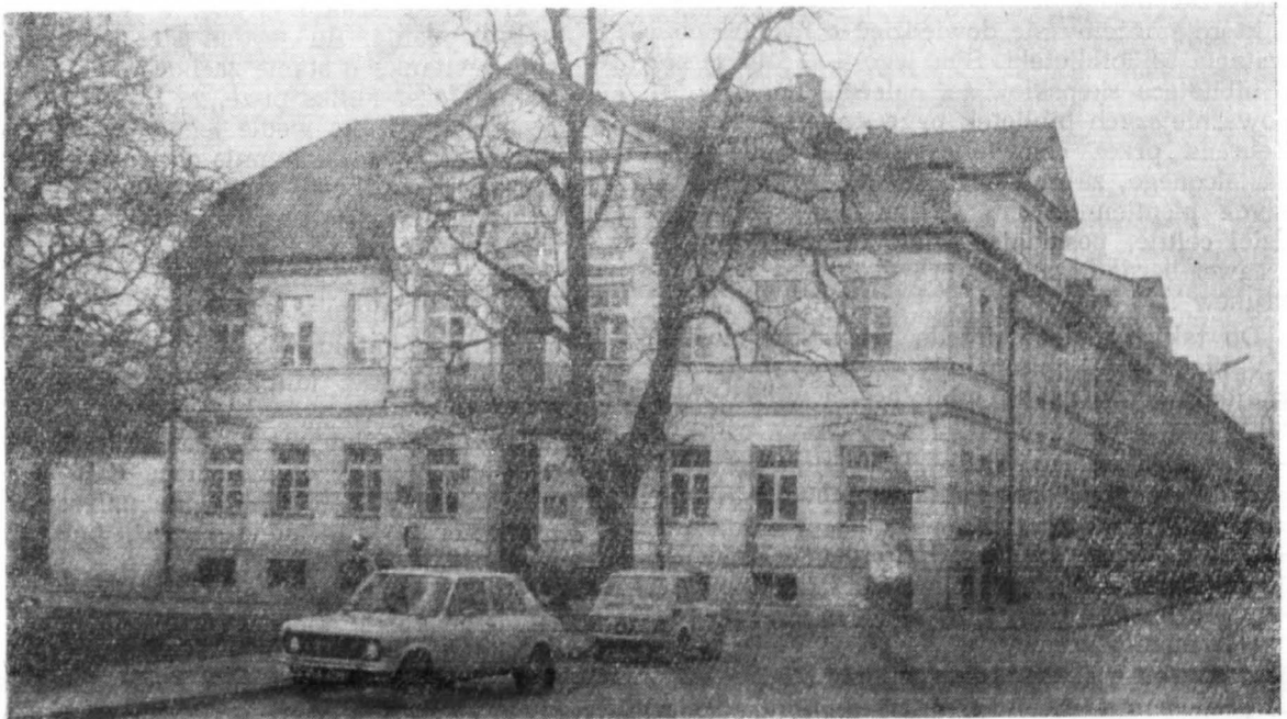
Zabytkowy dom „Pod Opatrznością”, w którym mieści się Biblioteka im. Zielińskich TNP.

Tak więc widzimy, że od samego początku istnienia, Towarzystwo położyło główny nacisk na utworzenie biblioteki, która według Statutu miała być czynna 4 razy w tygodniu dla korzystania z czasopism na miejscu i dwa razy w tygodniu dla wypożyczania książek do czytania w domu. Czytelnicтво, od samego początku działania tej placówki, rozwijało się dość dobrze, o czym świadczy chociażby fakt, że prenumerowano bieżąco czasopisma wychodzące, a zainteresowanie społeczeństwa działalnością biblioteki znalazło wyraz w darach pieniężnych i książkowych.