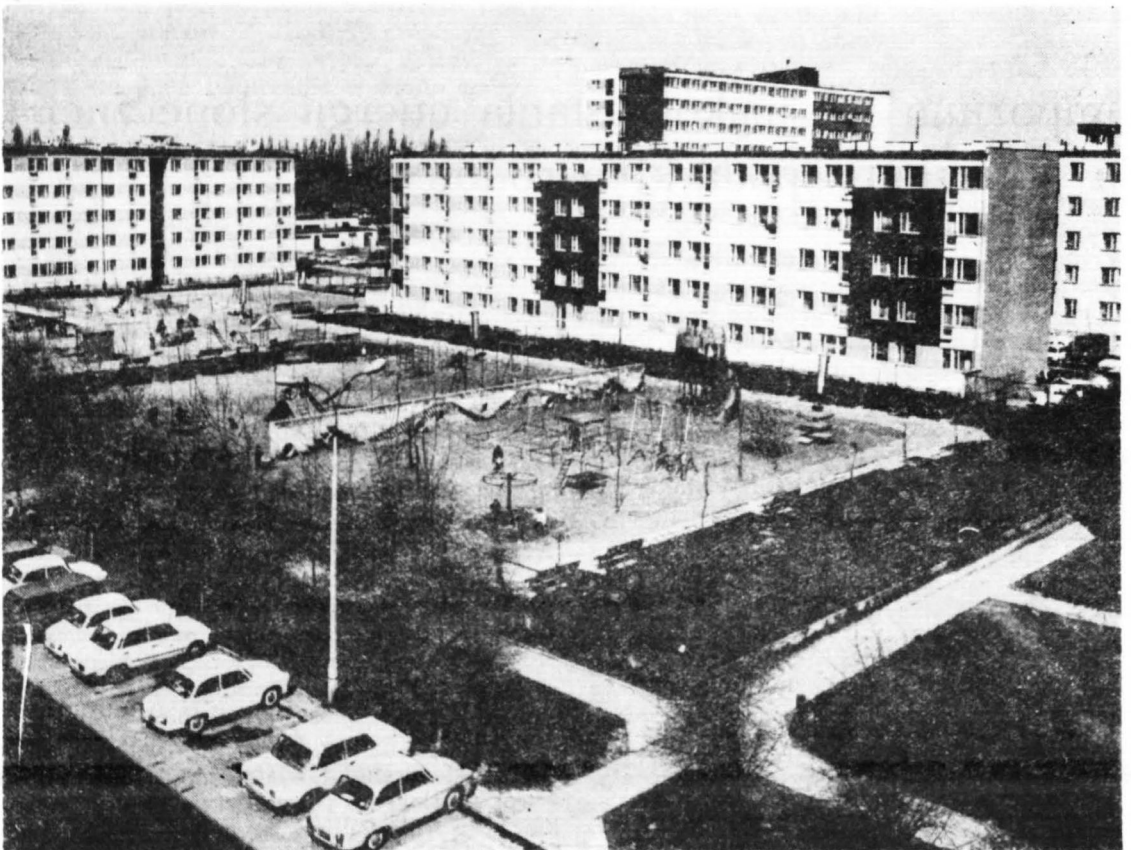
Ogólny widok Ogródka Jordanowskiego na Osiedlu Tysiąclecia

18 lutego odbywa się zebranie informacyjne dla kandydatów na członków PSM. Wobec zadeklarowania chęci przystąpienia do spółdzielni 16 osób, jego uczestnicy postanowili zwołać Walne Zebranie Założycielskie na dzień 28