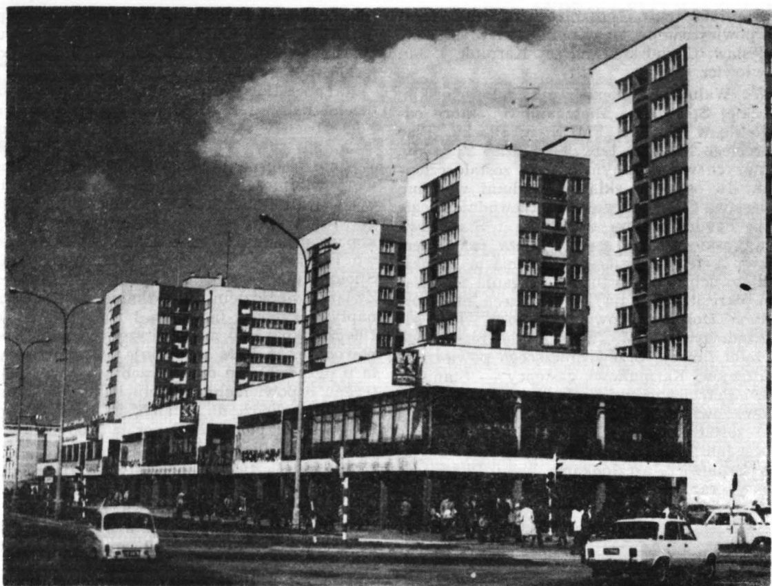
Nowe Centrum Płocka. Wysokościowce na Osiedlu Tysiąclecia.

ława Lewandowskiego. Członkowie — założyciele upoważnili zarząd do zaciągania zobowiązań do kwoty 1.760 tysięcy złotych na rok 1958 oraz przyjęli preliminarz budżetowy na sumę 22.761,500 zł. Według § 2 Statutu Robotniczej Spółdzielni Mieszkaniowej (przyskładowej, typu lokatorskiego) terenem działania miało być miasto Płock.