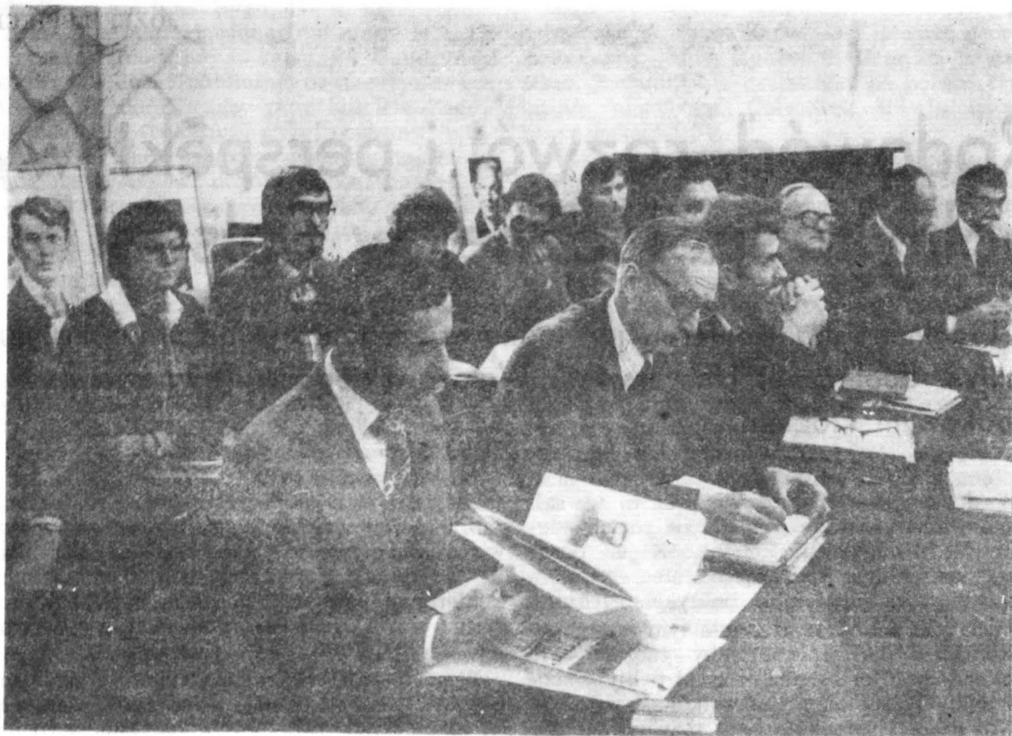
Sala obrad IX Ogólnopolskiej Konferencji Naukowej

drogą przebytą przez politykę społeczną w Polsce i perspektywami jej dalszego rozwoju.