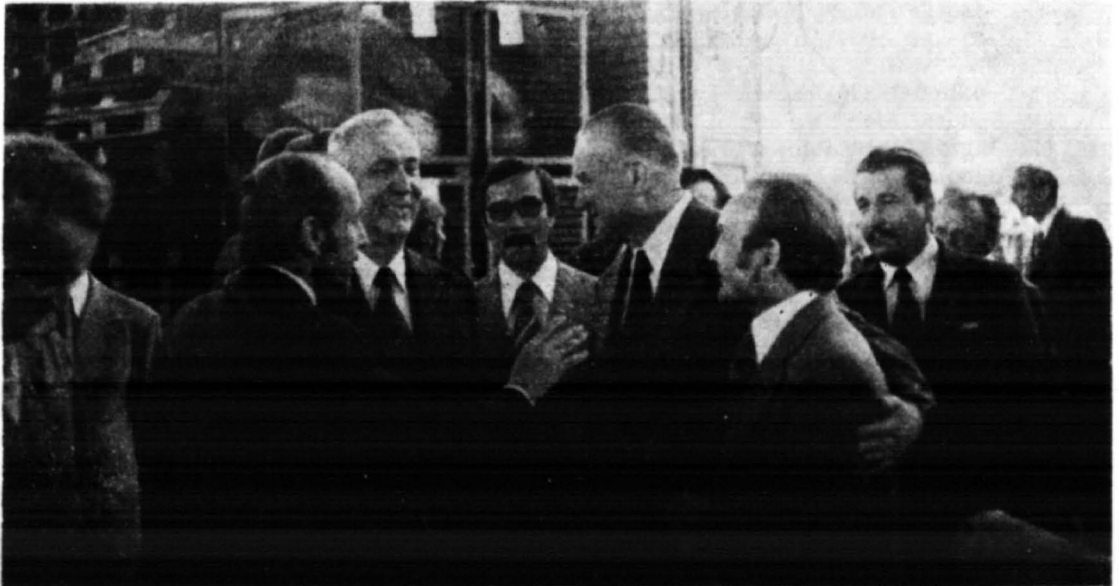
11 września 1976. Pierwszy Sekretarz KC PZPR Edward Gierek i Prezes Rady Ministrów Piotr Jaroszewicz oraz towarzyszące im osoby w Fabryce Maszyn Zniwnych w Płocku w przeddzień Ogólnopolskiego Święta Plonów — Centralnych Dożynek.

Rozwój gospodarki i praktyka minionego okresu w całej pełni potwierdziły słuszność generalnej polityki naszej partii, polityki socjalistycznego uprzemysłowienia, opartego na rozwoju własnej bazy paliwowo-energetycznej i surowcowej oraz wszechstronnym rozwoju struktury naszego przemysłu.