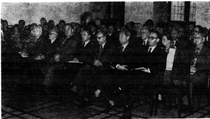
Okolo 120 członków Instytutu Bałtyckiego i zaproszonych gości w tym 5 delegacji zagranicznych wzięło udział w Sesji Jubileuszowej.

„Szanowne Prezydium Sesji Jubileuszowej! Panie Wojewodo Gdański! Drodzy członkowie Instytutu Bałtyckiego! Panie i Panowie!