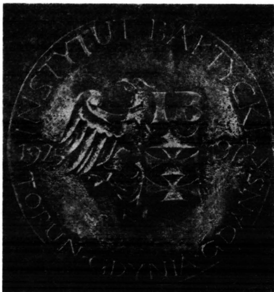
Medal Instytutu Bałtyckiego wybity z okazji jubileuszu 50-ciolecia. (awers i rewers).