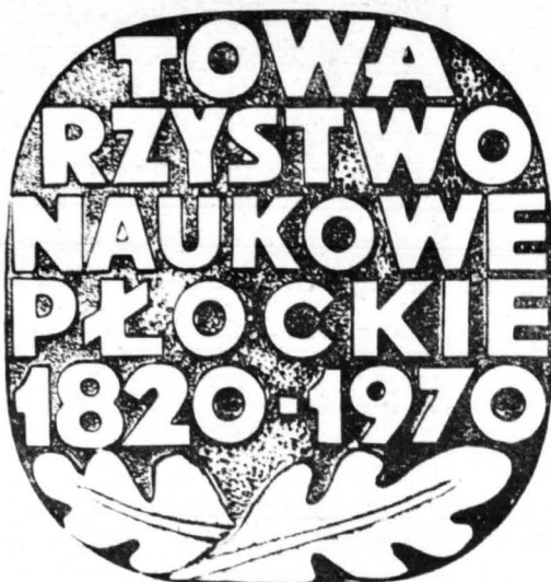
Medal pamiątkowy Towarzystwa Naukowego Płockiego, wybity w Mennicy Państwowej z okazji 150-lecia założenia, według projektu Stanisława Makulińskiego

tylko fragmentaryczne podyktowanie innymi względami. Postawienie sobie za zadanie zbadania sprawności ekonomicznej gospodarstw chłopskich i folwarków miało za cel rozeznanie sprawy do przeciwdziałania wykupywaniu gospodarstw przez Niemców. Opracowanie przez Towarzystwo Naukowe działu statystycznego na powiatowych wystawach rolniczych w Płocku, Lipnie i Ciechanowie było wprowadzeniem do „Atlasu Statystycznego Królestwa Polskiego”, obrazującego w części rolniczej m. in. stosunki wsi, płace służby folwarcznej czy serwituty wiejskie.