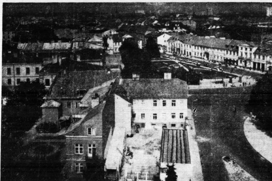
Płock. Fragment Starego Miasta widziany z Wieży Zegarowej Zamku Książąt Mazowieckich. Po lewej stronie na dole zabytkowy budynek Towarzystwa Naukowego Płockiego pochodzący z XV wieku.

Należy też wspomnieć o współpracy TNP z Instytutem Rozwoju Wsi i Rolnictwa oraz o organizowaniu lub współudziale Towarzystwa w sesjach naukowych i konferencjach jak sesja Komitetu Badań Rejonów Uprzemysławianych PAN (1970) czy (1975) na temat „czynnika ludzkiego” w tym regionie.