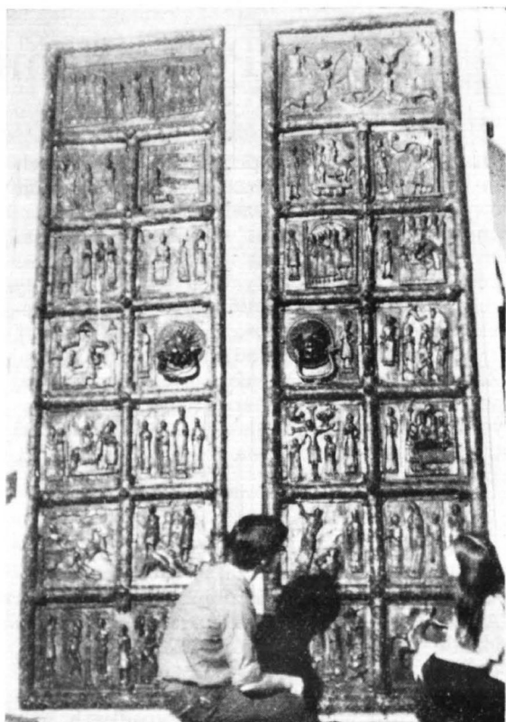
Wykonana przez Pracownię Konserwacji Zabytków w Szczecinie — kopia romańskich „Drzwi Płockich” została wystawiona w dniach od 7—31 sierpnia 1972 r. w Muzeum Historycznym m. st. Warszawy na Starym Mieście

„Przewiezienie do Polski kopii* (w naturalnej wielkości) drzwi brązowych katedry w Płocku i tymczasowe zamontowanie jej w Muzeum Historycznym w Warszawie wzbudziło powszechne zainteresowanie tym wspaniałym zabytkiem. Przypomnijmy, że z inicjatywy To-