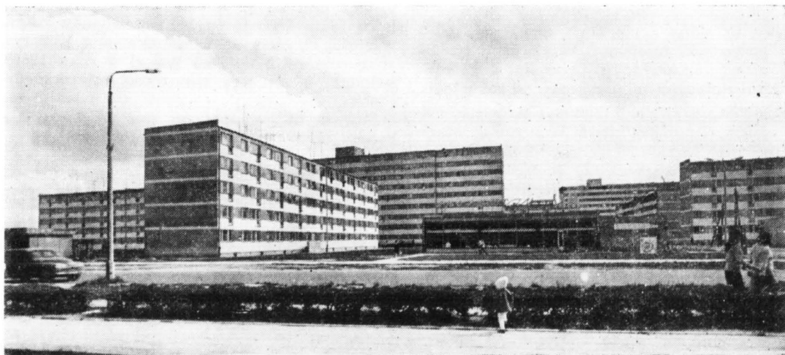
Budynki na największym osiedlu spółdzielczości mieszkaniowej — Osiedlu Tysiąclecia. W latach 1965 — 1971 wybudowano 2.535 mieszkań z 7.410 izbami dla 9.450 osób.