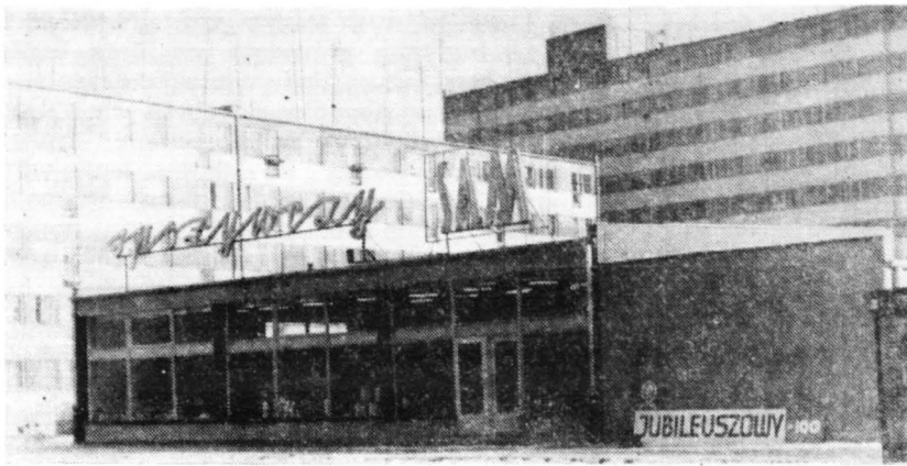
SAM ogólnospożywczy WPHS „Zgoda” nr 100 przy ul. Łukasiewicza.