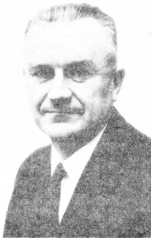
Prezes Rady Ministrów — Piotr Jaroszewicz.

W dniu 8 lipca 1971 r. odwiedził Towarzystwo Naukowe Płockie Prezes Rady Ministrów Piotr Jaroszewicz, przybyły do Płocka w związku z jubileuszem 100-lecia przemysłu maszyn