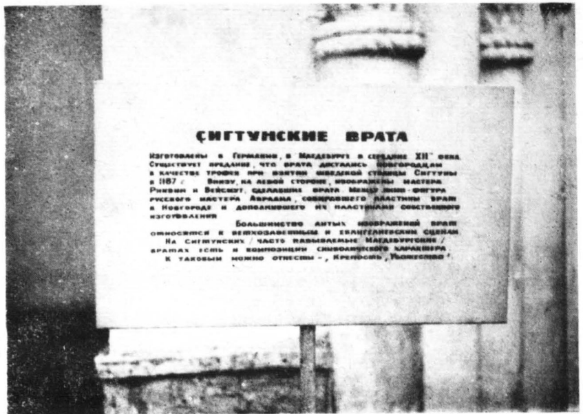
Tablica informacyjna — znajdująca się przy „Drzwiach Płockich”.