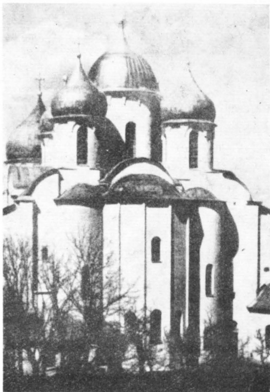
Centralnym punktem Kremla Nowogrodzkiego jest zbudowany w latach 1045—1050 pięciosałkowy Sofijski Sobór (katedra św. Zofii), w którym znajdują się romańskie „Drzwi Płockie”. Widok od strony wschodniej.

Stąd też w ZSRR należy wykonać tylko matrycę z elastomerów. Są to tworzywa krzemorganiczne charakteryzujące się m. in. dużą odkształcalnością i pozwalające na nieznaną dotąd dokładność przy odciskaniu przedmiotów reprodukowanych. Matryca wykonana zostanie z kompozycji polskich i zagranicznych elastomerów. Ministerstwo Kultury i Sztuki przy-