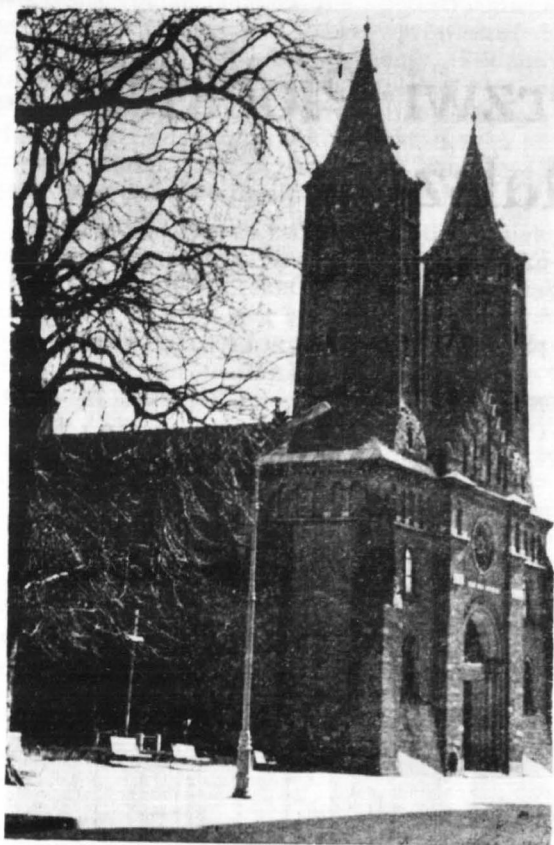
Płocka bazylika katedralna, konsekrowana w 1144 r. (widok obecny). Tu ponad 200 lat znajdowały się romańskie drzwi brązowe, które od ponad 500 lat znajdują się w katedrze św. Zofii (Sofijski sobór) w Nowogrodzie Wielkim.

muje, że tut. Ministerstwo Kultury wyraziło zgodę na sporządzenie kopii „Drzwi Płockich”, których oryginał znajduje się w Nowogrodzie Wielkim, a kopia w gipsie w Muzeum Historycznym na Placu Czerwonym w Moskwie. Strona radziecka podkreśliła, że koszty sporządzenia kopii poniesie strona polska.