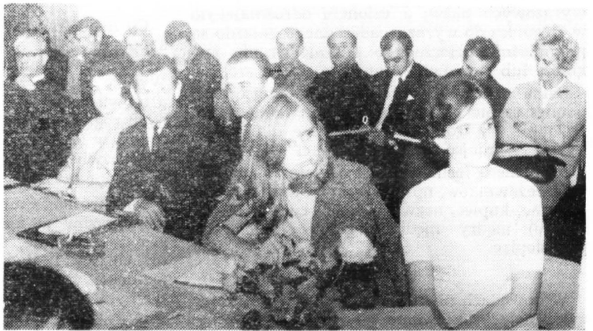
Uczestnicy seminarium doktoranckiego (10. X. 1970 r.)