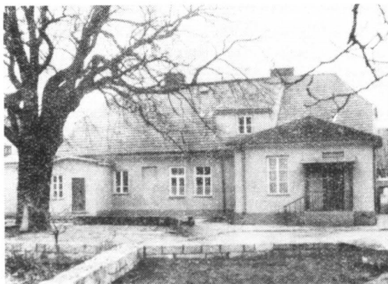
Dom Władysława Broniewskiego z historycznym dębem na dziedzińcu