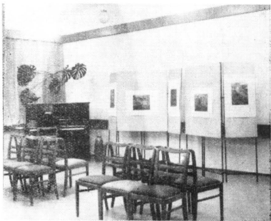
Sala wystaw ZNP

Klub ma do swojej dyspozycji dwa pomieszczenia: kawiarnię z barkiem kawowym i słodczykami oraz salę imprezową, w której będą się odbywać zebrania po-