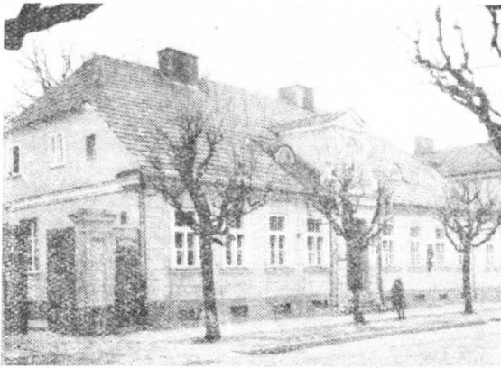
Dom, w którym urodził się Władysław Broniewski, obecnie „Dom Nauczyciela”

Od szeregu lat nauczyciele i władze ZNP czyniły starania o wybudowanie nowego Domu Nauczyciela w Płocku. Miejska Rada Narodowa uchwałą swoją z dn. 23.II.62 r. postanowiła „odać Związkowi Nauczycielstwa Polskiego na środek kulturalny nauczycieli regionu płockiego” dom, w którym urodził się i spędził lata młodzieńcze Władysław Broniewski, największy poeta rewolucyjny, Honorowy Obywatel m. Płocka.