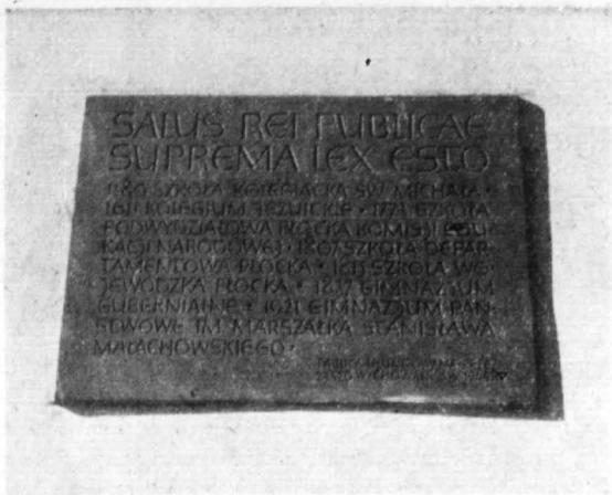
Tablica pamiątkowa z okazji oddania do użytku nowego skrzydła lic. Małachowskiego