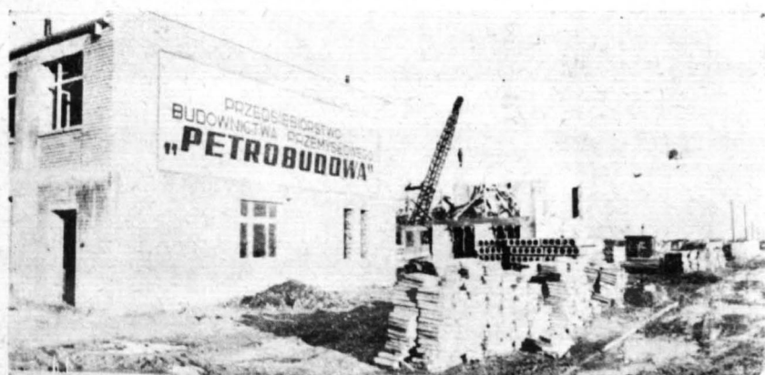
Na placu budowy

Poważne zmiany nastąpią w dziedzinie zatrudnienia. Przedsiębiorstwo Budownictwa