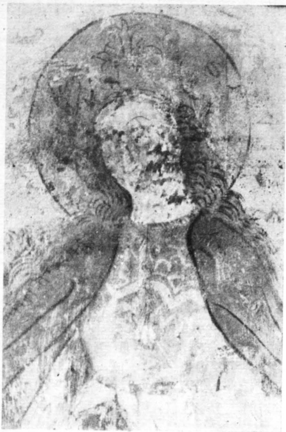
Sw. Katarzyna (fragment) ściana wschodnia

W czasie rozważań nad sierpecką polichromią rodzi się jedno jeszcze pytanie, mianowicie: kto mógł być jej autorem. Nie był nim prawdopodobnie twórca malowideł w Golubiu. Nie był także malarz pracujący w Czerwińsku, o czym mówi analiza formalna obu zachowanych reliktyw. Fragmenty sierpeckie obce są zupełnie i sąsiednim malowidłom toruńskim.