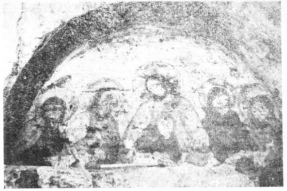
Ostatnia wieczerza (ściana północna)

Architektura zachowanych malowideł nie polega tu na geometrycznym podziale ścian na pola, w które wkomponowane byłyby skolei poszczególne sceny, jak to często widoczne było w pełnym średniowieczu. Elementy całego zespołu wykorzystują w sposób raczej dowolny poszczególne pola ścian, przy czym nie oddzielone są one od siebie granicami, a w każdym razie granic tych w obecnym stanie zabytku dostrzeć się nie można. Bezspornie tworzą one zwarty jakiś system ikonograficzny, który jednak z braku wszystkich składowych elementów, powiązać z sobą w jedną całość jeszcze nie podobna. W każdym razie odpowiadać on musiał tytułowi kościoła i jego przeznaczeniu. Ostatnia Wieczerza, Weroikon, Ukrzyżowanie Chrystusa i Sąd Ostateczny to tematyka zbliżona do problematyki śmierci, a postacie świętych męczenników zapewne do wzoru życia dla czytelnika i wiernych.