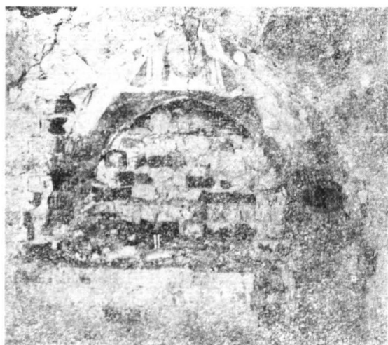
Chusta św. Weroniki

dującym pod względem artystycznym, Krakowem, przemawiają za tym przypuszczeniem.