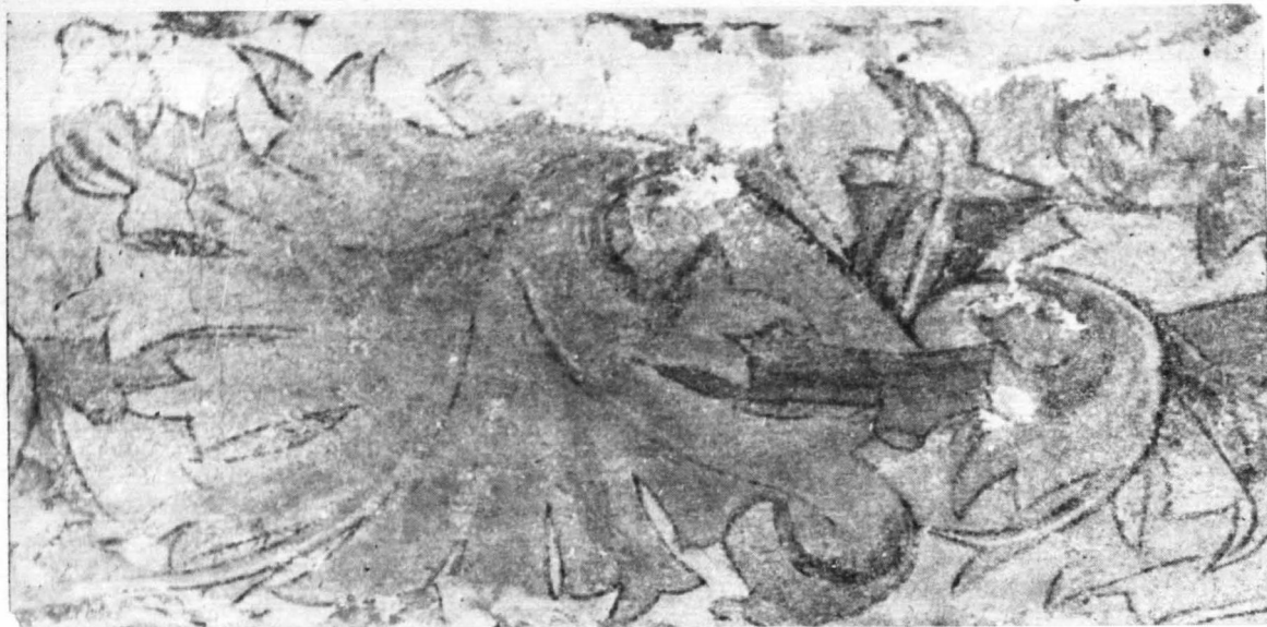
Ornament roślinny w glifie okiennym (ściana południowa)

wrażliwej na wilgoć smalty, żelazowych oraz innych pigmentów. Oranże i żółcienie nakładał malarz impasto.