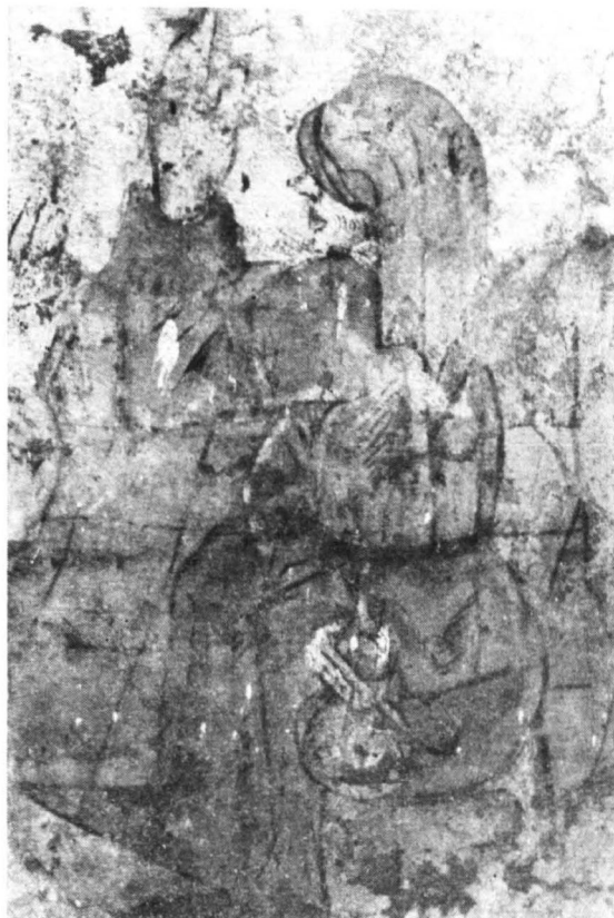
Ostatnia wieczerza (fragment — Judasz?)

niejszych, powstać niewątpliwie musiały w czasie restauracji katedry bezpośrednio po pożarze w roku 1530. Istnienie warsztatów lokalnych oraz żywe kontakty z innymi miastami Polski, zwłaszcza z pro-