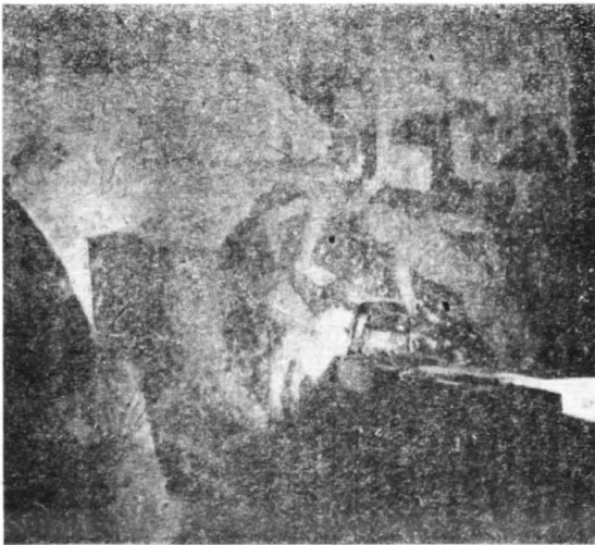
Sąd ostateczny (ściana południowa)

Na gruboziarnistej zaprawie widoczne są kompozycje plam czerwieni, błękitu, zieleni, brązu opisane konturem czarnym pochodzenia roślinnego. Barwy występują tu czyste, rzadko mieszane lub łamane. Malarz używał przy pracy nieorganicznej minii, azurytu, malachitu,