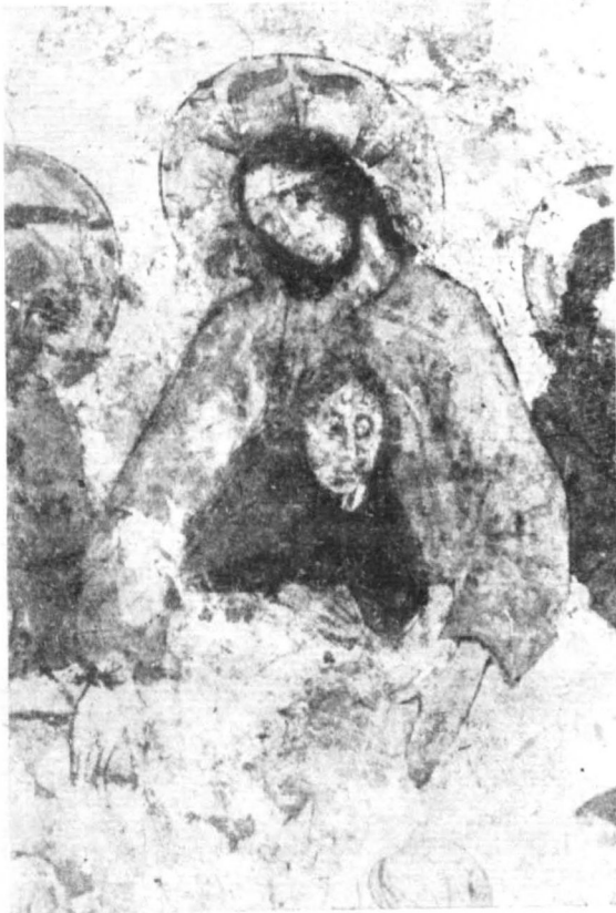
Ostatnia wieczerza (fragment)

dzielił na szereg mniejszych, usadawiając w nich jakby samodzielne opracowanie stalugowe. Luźno powiązane są one z sobą zarówno kompozycyjnie jak stylistycznie. Wygląda to tak, jak gdyby malarz posługiwał się szeregiem poszczególnych wzorów, z których mówiąc stylem współczesnym komponował fotomontaż. Nie było to trudne, bowiem w owym czasie po całej Europie wędrowało szereg drzeworytniczych odbitek, które spełniały rolę wzorcowych kompozycji chętnie realizowanych przez pomniejszych cechmistrzów.