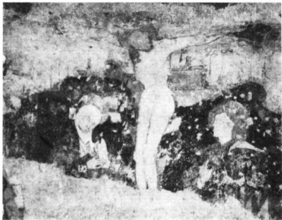
Ukrzyżowanie (ściana wschodnia)