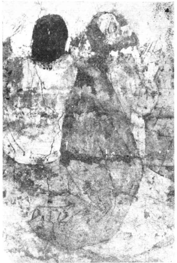
Ostatnia wieczerza (fragment)

Obok graficznego płaskiego sposobu przedstawiania postaci widać dobitnie chęć opanowania głębi obrazu w scenach bardziej złożonych jak Ukrzyżowanie lub Ostatnia Wieczerza, przy czym widać, że malarz porał się tu z zagadnieniami perspektywy, które nurtowały w tym czasie wielkiego Albrechta Dürera i Leonarda da Vinci. Mimo usiłowania wiązania się mistrza z protorenesansem, więcej jednak znajduje tu historyk sztuki gotyckiego tradycjonalizmu. Świadczy o tym raczej stalugowe interpretowanie dzieła niż monumentalne i ściennie jego opracowanie. Twórca nie wytworzył jednolitej koncepcji, a płaszczyzny, które miał zdobić po-