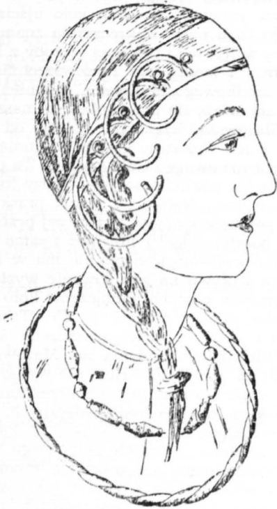
Rekonstrukcja sposobu noszenia kablączków skroniowych.

Kablączki puste były wyrabiane z blachy brązowej oraz srebrnej. Wszystkie okazy mazo-