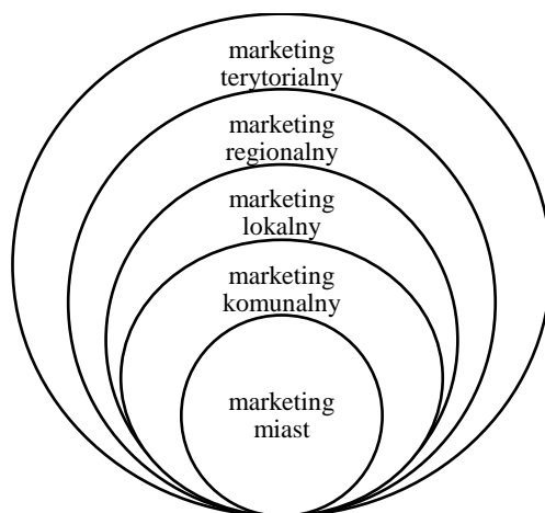
Rysunek 1. Struktura marketingu terytorialnego

W praktyce marketing terytorialny dotyczy działań podejmowanych przez samorząd terytorialny, utworzony do realizacji zadań publicznych (lokalnych w przypadku gmin i powiatów, regionalnych w przypadku województw) mających na celu zaspokojenie potrzeb zbiorowych występujących na danym obszarze. Marketing terytorialny jest najszerszym określeniem dotyczącym obszaru, bez względu na jego charakter, wielkość czy przynależność administracyjną. Oprócz marketingu terytorialnego wyróżnia się jeszcze cztery obszary, w których występuje marketing miejsc. Jest to marketing: regionalny, lokalny, komunalny oraz marketing miast (Sekuła, 2005) (rys. 1).