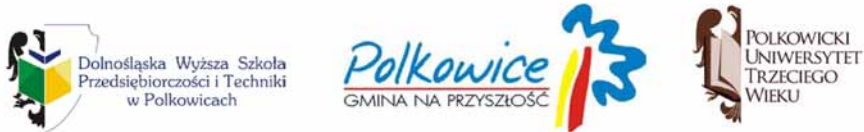
Rysunek 1. Logotypy: Dolnośląskiej Wyższej Szkoły Przedsiębiorczości i Techniki w Polkowicach, Polkowic oraz Polkowickiego Uniwersytetu Trzeciego Wieku.