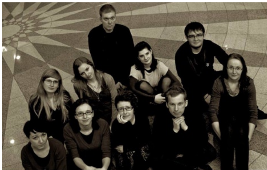
Członkowie Prasoznawczego Koła Naukowego w roku akademickim 2012/2013