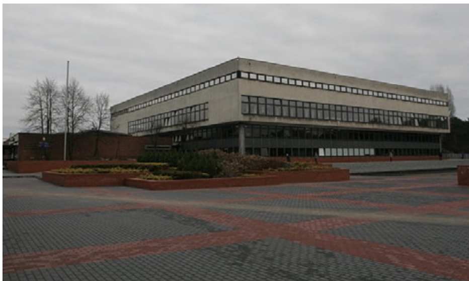
Biblioteka Uniwersytecka w Toruniu – pierwsza siedziba toruńskiej bibliologii