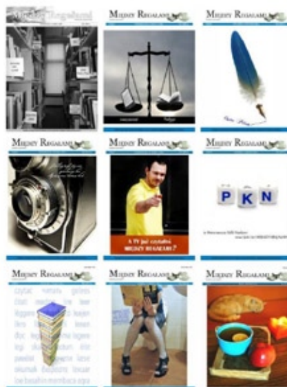
„Między Regałami” – pismo Prasoznawczego Koła Naukowego, okładki wybranych numerów