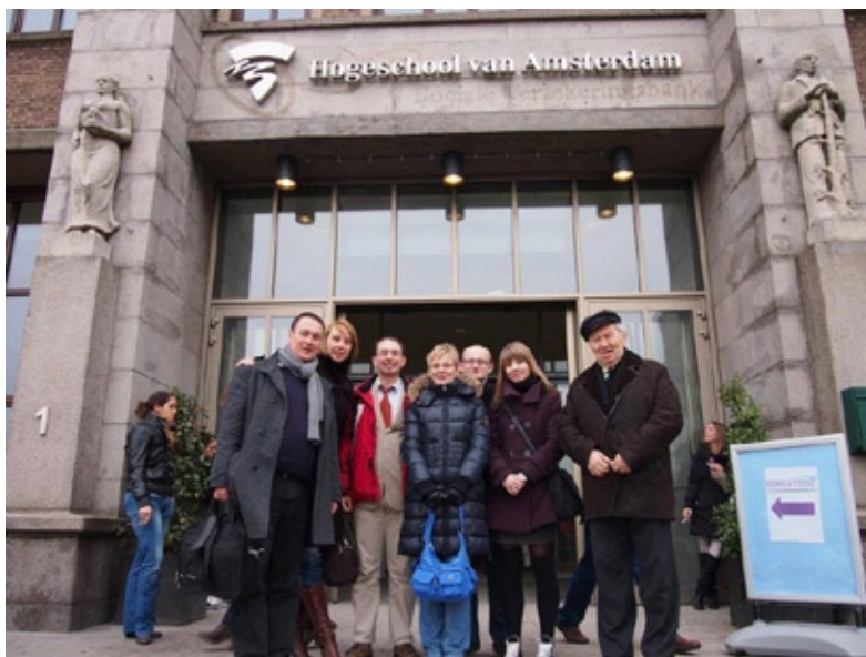
Pracownicy, doktoranci i studenci Instytutu podczas sympozjum BOBCATSSS, Amsterdam 23–25 stycznia 2012 r.