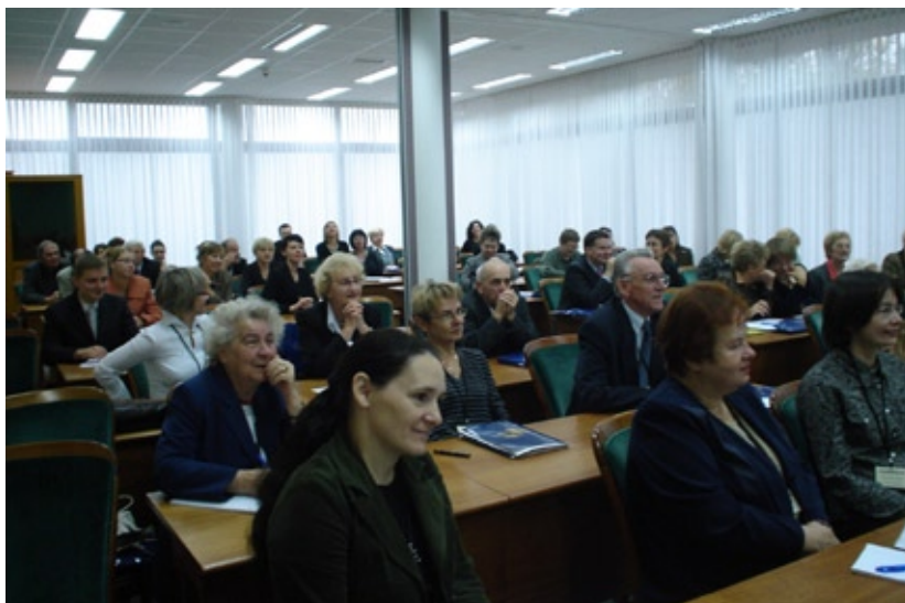
Konferencja jubileuszowa Instytutu, Toruń 23 października 2007 r.