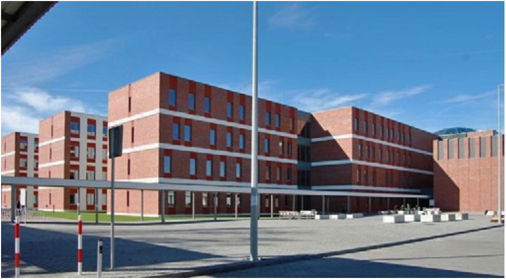
Collegium Humanisticum – obecna lokalizacja Instytutu Informacji Naukowej i Bibliologii UMK

Dawnej i Współczesnej, Zakładu Wiedzy o Prasie oraz Pracowni Metod Komputerowych 4 . Funkcję kierownika Katedry pełnił prof. dr hab. J. Tondel (1994–2004).