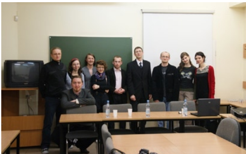
Uczestnicy panelu dyskusyjnego „Media studenckie – wczoraj, dziś i jutro”, Toruń 13 kwietnia 2011 r.