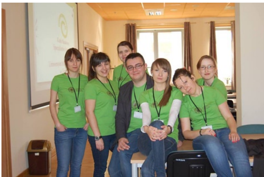
Członkowie Koła Naukowego Specjalistów Informacji w roku akademickim 2012/2013

W związku z częściowo pokrywającymi się obszarami działalności wszystkich działających w Instytucie Kół oraz przynależnością wielu jego członków do kilku struktur jednocześnie, w roku akademickim 2014/2015 zaplanowano ich połączenie w jedno – Studencko-doktoranckie Koło Naukowe „e-Print”.