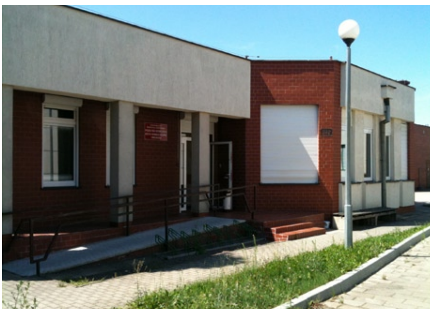
Budynek Katedry Bibliotekoznawstwa i Informacji Naukowej UMK przy ulicy Gagarina 13a