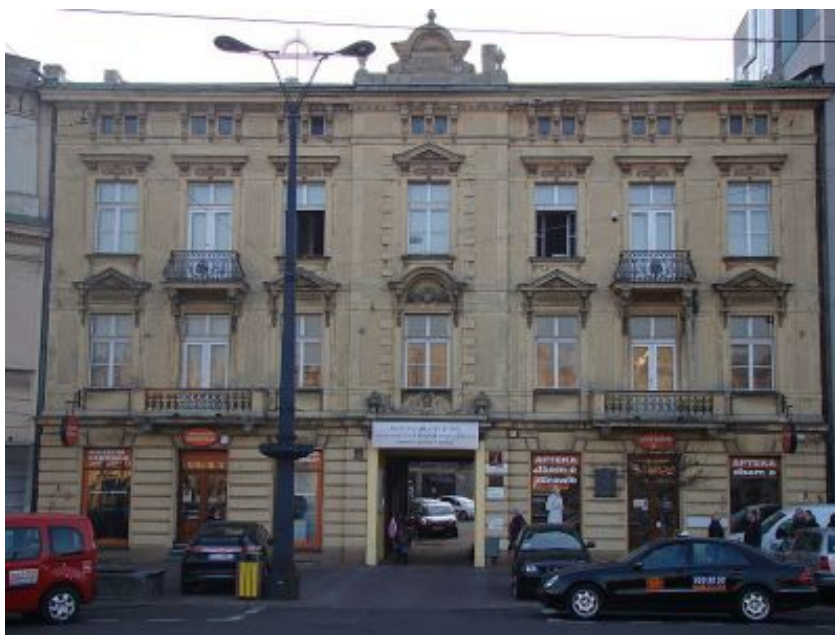
Fasada kamienicy przy pl. Wolności 2