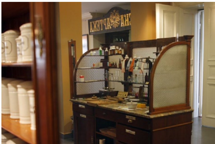
Stół recepturowy z wyposażeniem