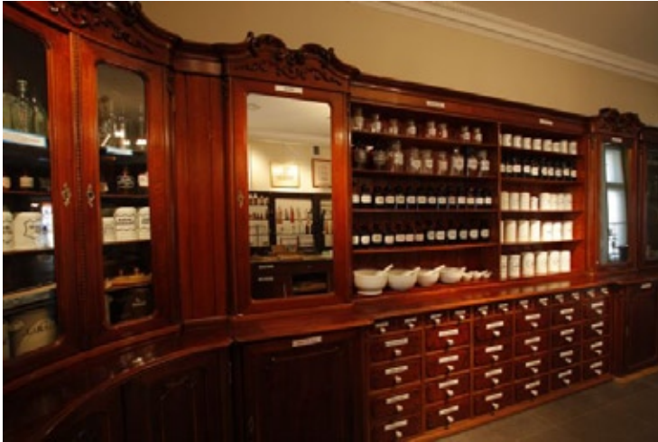
Meble apteczne z przełomu XIX i XX w.

Podstawową funkcją każdej placówki muzealnej jest gromadzenie, opracowywanie i prezentacja zbiorów. Do inwentaryzacji zbiorów muzeum wykorzystuje program komputerowy „musnet”. Muzeum prowadzi inwentaryzację elektroniczną. Każda karta inwentaryzacyjna zawiera dokładny opis eksponatu, jego wymiary i fotografię. W naszych zbiorach jest ok. 3000 eksponatów. Większą ich część stanowią darowizny od osób prywatnych, z aptek, czy od emerytowanych farmaceutów.