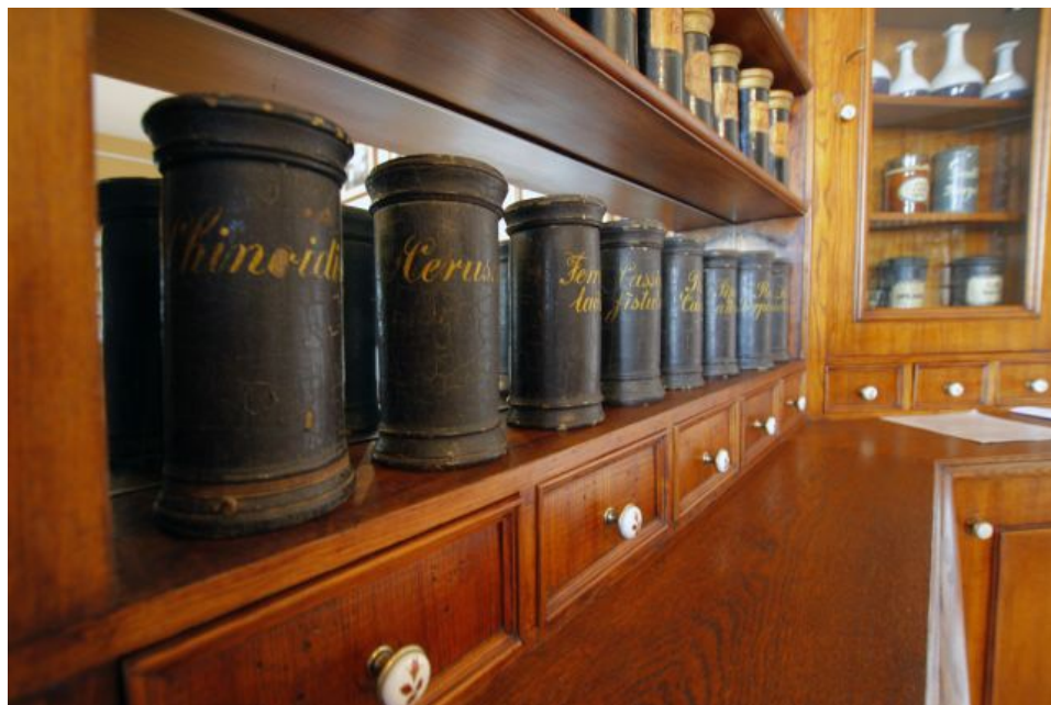
XVIII-wieczne drewniane puszki apteczne