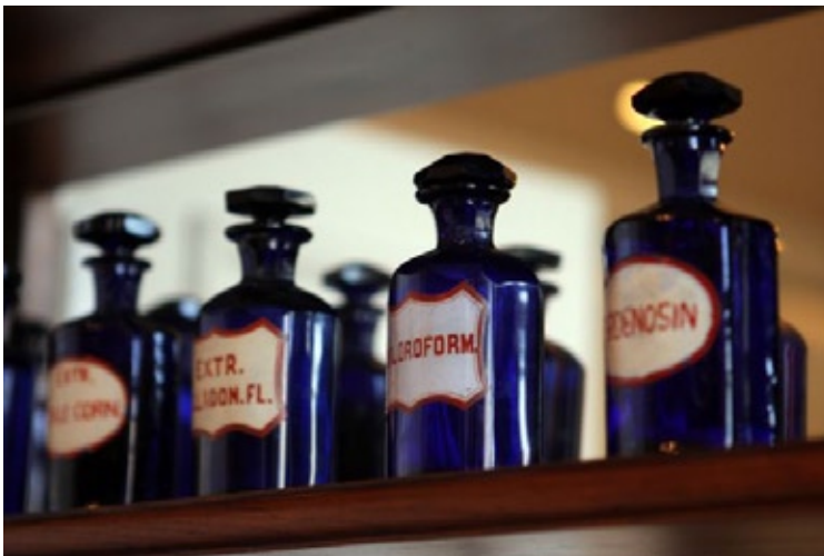
Kolekcja butelek aptecznych