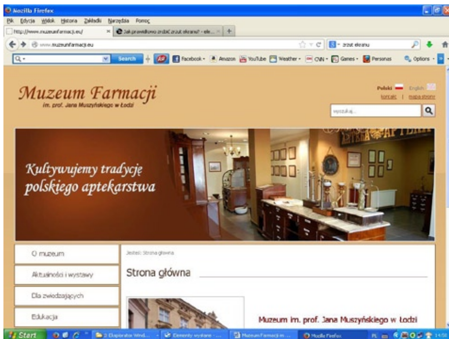
Strona internetowa muzeum

Muzeum posiada własną stronę internetową ( www.muzeumfarmacji.eu ) jak również konto na serwisie społecznościowym „Facebook” na których zamieszone są informacje o aktualnych wydarzeniach mających miejsce w naszej placówce.