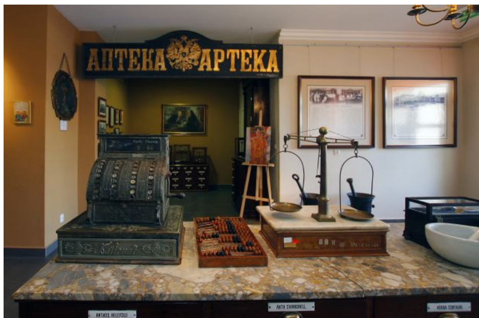
Parter muzeum z widoczną zabytkową kasą, wagą i szyldem aptecznym z 2 poł. XIX w.