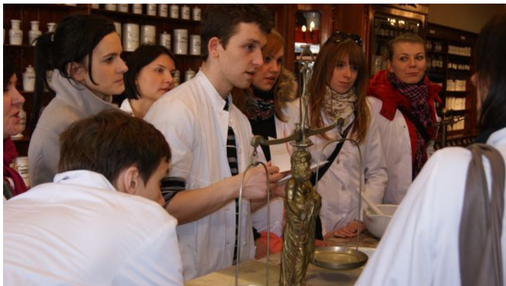
Studenci z „Młodej Farmacji” na zajęciach w muzeum

w Łodzi, Muzeum Farmacji w Krakowie, Muzeum Farmacji w Warszawie, Muzeum Farmacji w Lublinie, Muzeum Farmacji Apteki „Pod Łabędziem” w Bydgoszczy i Muzeum Techniki w Warszawie. Współpracujemy z Uniwersytetem Medycznym i Wydziałem Farmaceutycznym, a także z Uniwersytetem Łódzkim w tym z Wydziałem Biologii oraz z Wydziałem Geografii i Nauk o Ziemi. Muzeum współpracuje z Polskim Towarzystwem Farmaceutycznym (Sekcją Aptek, Sekcją Historii Farmacji oraz Sekcją Studencką PTFarm „Młoda Farmacja”). Wiedzy na temat działalności muzeum można zasięgnąć poprzez Łódzkie Centrum Informacji Turystycznej.