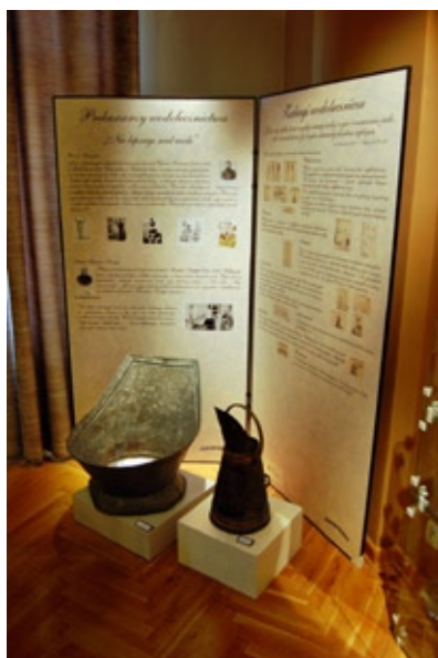
„Zimna woda zdrowia doda...”