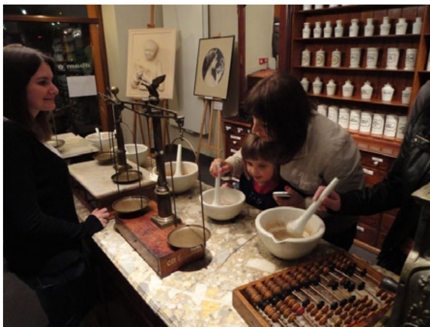
Noc Muzeów 2013