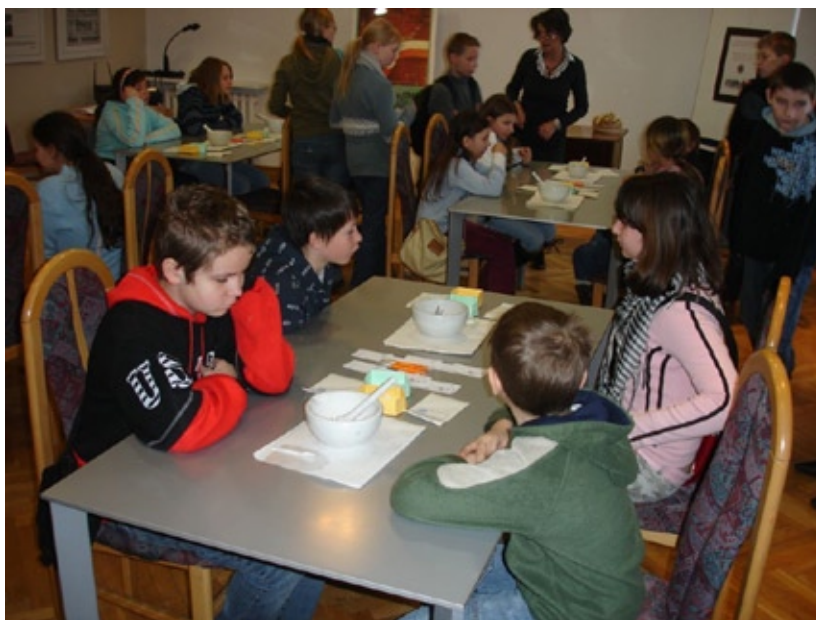
Dzieci na zajęciach

Muzeum oferuje zajęcia edukacyjne dla dzieci i młodzieży. Dzieci wykorzystując zdolności manualne rozcierają kostki cukru w moździerzach robiąc w ten sposób cukier puder. Grupom szkolnym proponujemy przygotowywanie pigułek, czopków z kolorowej plasteliny, a także odmierzanie płynów za pomocą kroplomierzy. Dla starszych dzieci oferujemy rozwiązywanie krzyżówek farmaceutycznych oraz odszukiwanie na mapie historycznych miejsc naszego miasta. Uczymy w ten sposób historii miasta i topografii. Lekcje muzealne cieszą się dużym zainteresowaniem i powodują że nasze muzeum staje się atrakcyjnym miejscem na mapie muzealniczej Łodzi.