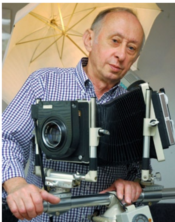
Mgr Stefan Ciechan, fotograf