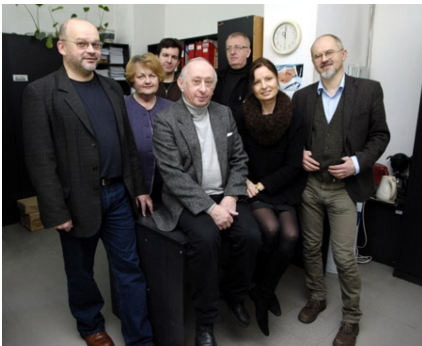
Zespół Forum Akademickiego