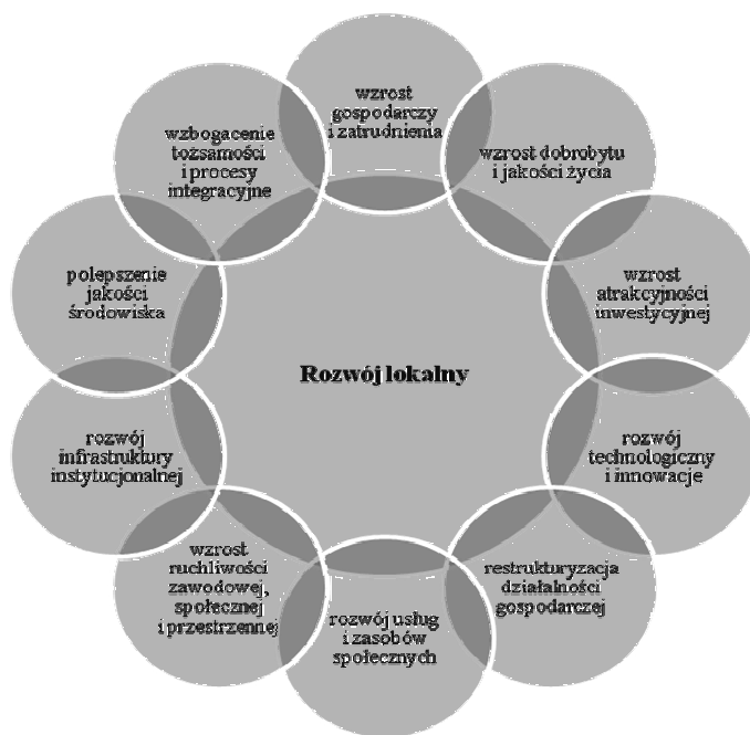
Rys. 3. Składowe rozwoju lokalnego

Podstawą rozwoju lokalnego są endogeniczne czynniki rozwoju, w tym m.in. lokalne potrzeby, zasoby, ludność, organizacje, przedsiębiorstwa 9 . Rozwój w skali lokalnej przejawia się w dziesięciu podstawowych obszarach (rys. 3).