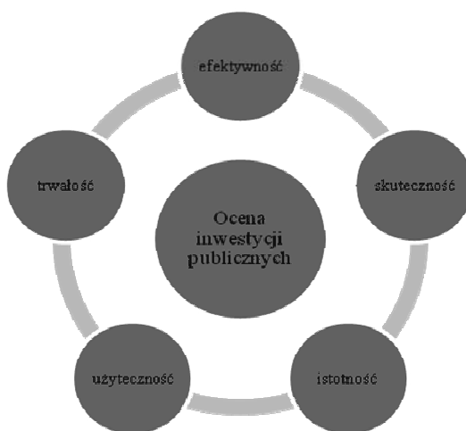
Rys. 5. Dotychczasowe kryteria oceny projektów publicznych

Koncepcja ta ma na celu identyfikację zależności występujących pomiędzy procesami inwestycyjnymi a wyróżnionymi obszarami działalności gminy, np. transport i łączność, gospodarka mieszkaniowa, oświata i wychowanie, ochrona zdrowia, zadania polityki społecznej, gospodarka komunalna i ochrona środowiska, turystyka, kultura fizyczna i sport. Ma to dotyczyć zarówno aspektów mierzalnych, jak i niemierzalnych, gdyż tylko takie całościowe ujęcie sytuacji będzie sprzyjać pogłębionej ocenie zasadności realizacji procesów inwestycyjnych.