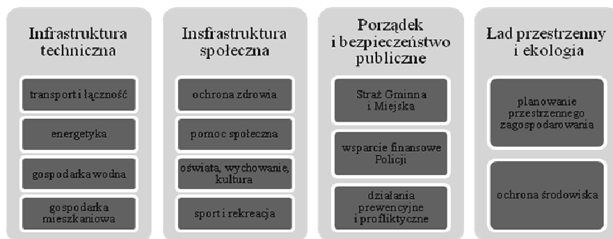
Rys. 1. Podstawowe grupy zadań realizowanych przez gminę

gospodarczej, usług społecznych, komunalnych i administracyjnych, zagospodarowania przestrzennego, środowiska przyrodniczego 7 .